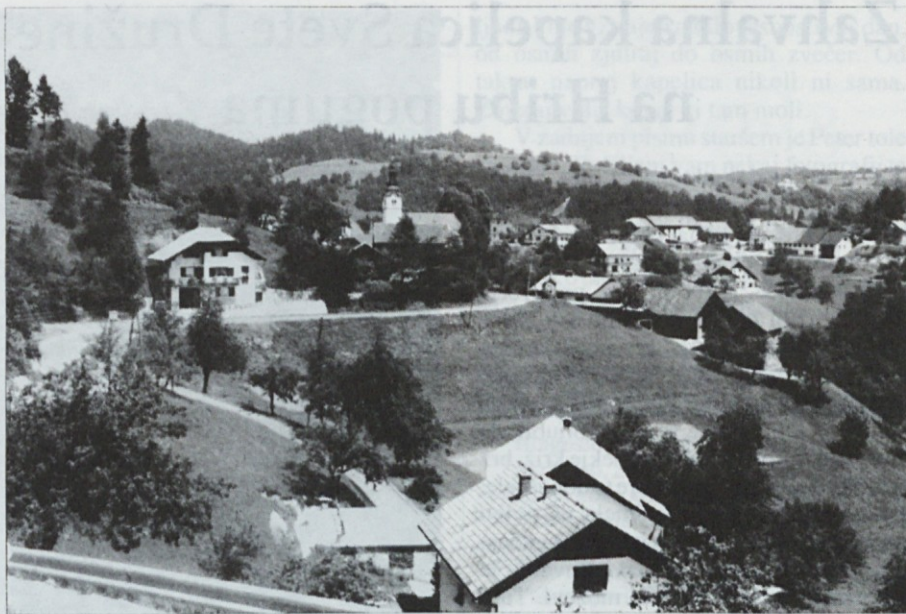
Središče Šentjošta s farno cerkvijo