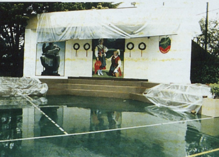
Pripravljeni oder in prostor za letošnji Slovenski dan v Slomškovem domu, ki ga zaradi naliva ni bilo mogoče rabiti.