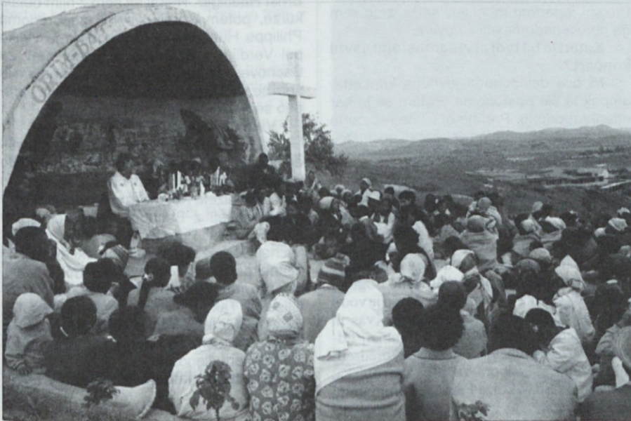
Na prvi petek v juniju mašuje misijonar Peter Opeka vaščanom svojega misijona na Madagaskarju v zahvalni kapelici Svete Družine na Hribu poguma

ljudi, ki so vztrajali na slovesnosti ves dan, od osmih zjutraj do osmih zvečer. Od takrat naprej kapelica nikoli ni sama. Zmeraj vidiš koga, ki tam moli.