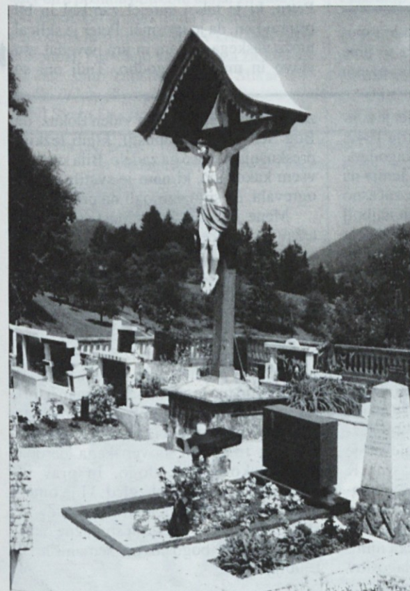
Farno pokopališče v Šentjoštu