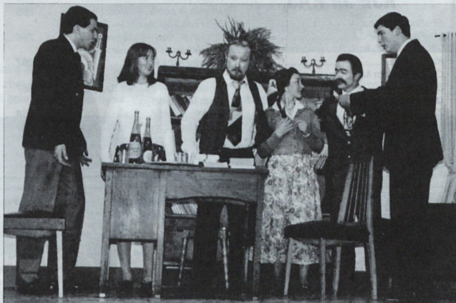
Iz igre „Glavni dobitek“ na Mladinskem dnevu v Slomškovem domu