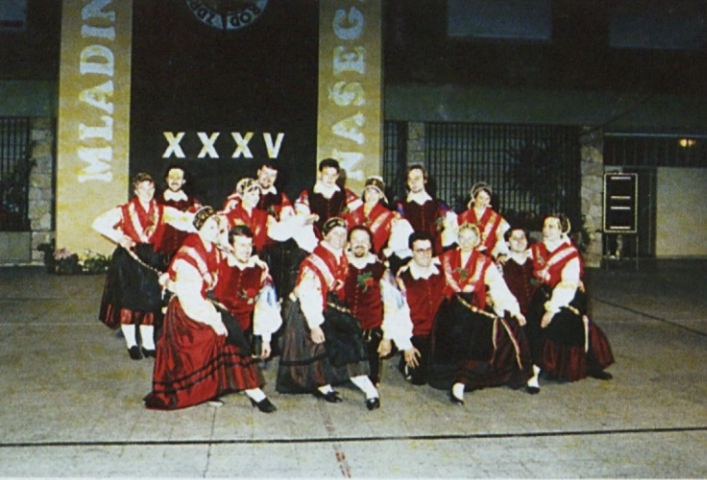
Nastop narodnih noš na 35. mladinskem dnevu v San Justu.