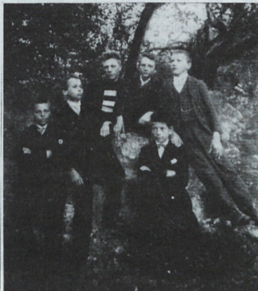
Škof dr. Gregorij Rožman kot dijak sredi šmihelskih dijakov v počitnicah 1902 (tretji od leve) v domači vasi Dolinčice.