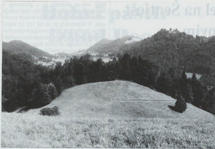
Pogled iz Šentjošta proti Krvinetovim in Piškovi domačiji