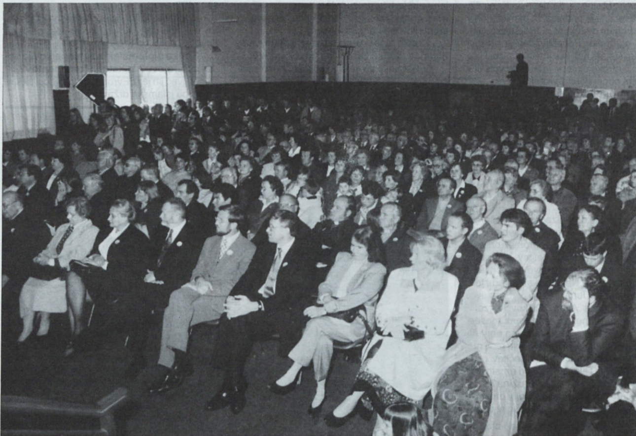
Program 41. Slovenskega dne v nedeljo 15. septembra v Slomškovem domu se je morali zaradi neurja izvajati v dvorani

Slovenski narod brez krščanstva sploh ne bi mogel obstati, brez krščanske civilizacije bi ga ne bilo. Če si iz slovenskega življenja danes odmisle vse, kar je krščanskega: Slovenija brez cerkva, brez Brižinskih spomenikov, brez