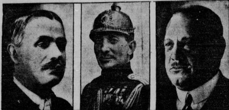
Generali Franco, Barrera in Martínez Anido bodo baje zopet začeli z diktaturo v Španiji, kjer je vse tako razburjeno, da je pričakovati revolucije.

ko škodo svojih zavarovancev, ki izgube kritje za svoje odškodninske zahtevke.