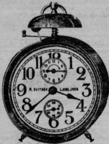
Budilke od Din 49 - naprej

Zahtevajte cenik zastoj in pošt. prosto!