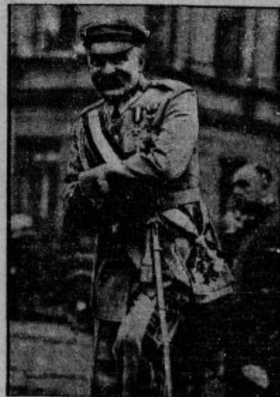
General Pilsudski, poljski diktator.

s Tudi pri volitvah v senat je zmagal diktator Pilsudski. Pri senatnih volitvah je bila udeležba zelo slaba in ni bilo no-