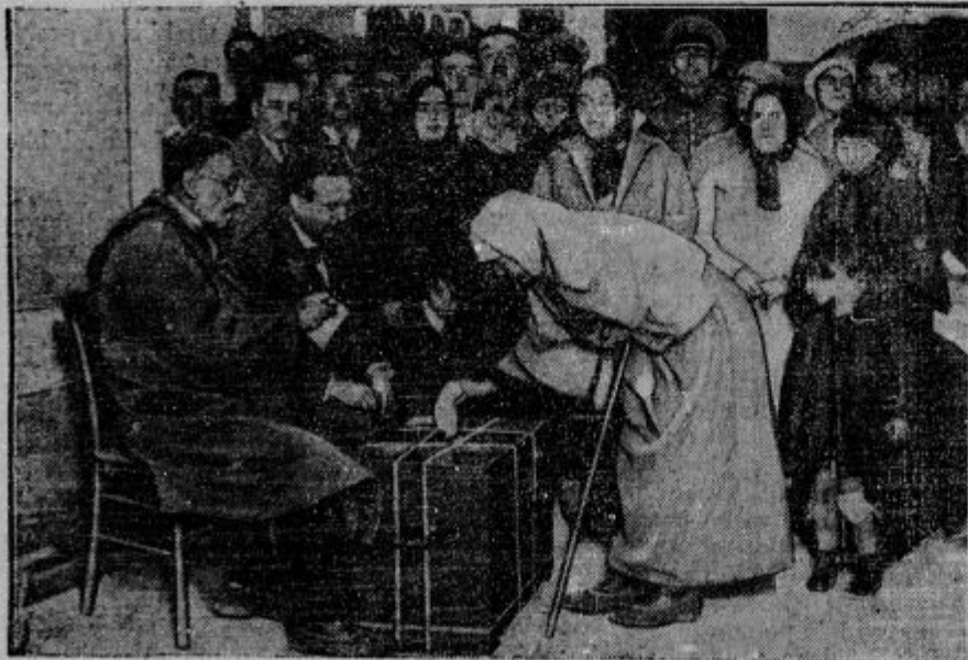
Kako volijo na Turškem. Slika nam kaže preprosto ljudstvo pred volilno skrinjo. Vsi so po evropsko oblečeni, ker jim je Kemal paš prepovedal nositi domačo obleko.

d Ob potoku pod prevrnjeno kočijo so našli mrtvega starosta mariborskih izvošč-