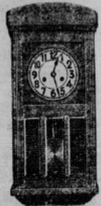
Stenske ure z bitljem, idočo štirinajst dni od

Zahtevajte cenik zastoj in pošt. prosto!