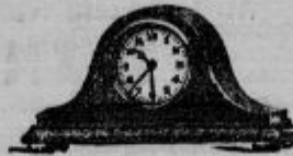
Budilke iz lesa od Din 84 - naprej, brez budilke Din 48-

Zahtevajte cenik zastoj in pošt. prosto!