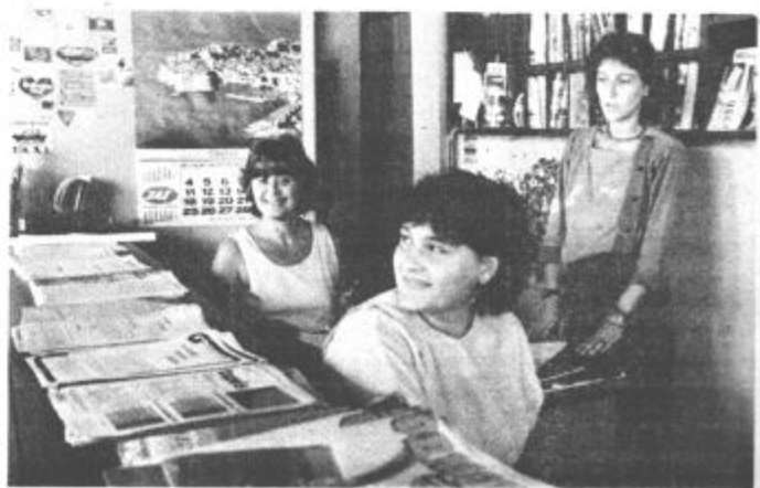
Izletnikova pa na Avtobusni postaji

In kako lahko dobite Eurocard kartico. Pri Kompasu dobite poseben obrazec, ki ga izpolnite, posebna komisija pa bo potem pretehtala vašo prošnjo. Seveda vam bodo več o tem radi povedali pri Kompasu.