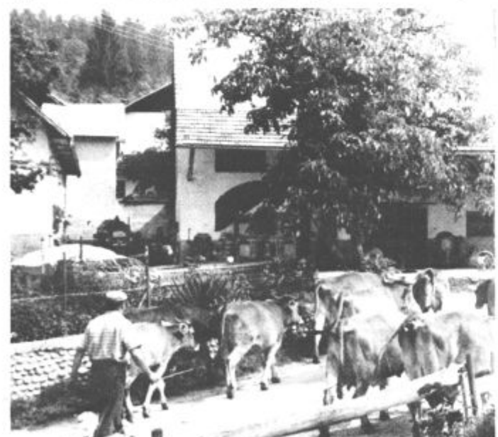
Le usmerjena, urejena in močna kmetija je lahko tudi turistična

»Prednosti, ki jih je na vas prinesel kmečki turizem so velike in tudi različne. Predvsem ne smemo ozko gledati samo dohodkovnega vidika, večje prednosti so druge. Predvsem so velike bolj urejena naselja, pa kmetije in to ne le turistične, tudi ostale. Zanimiv je primer s trgovci. Še pred leti so kmečko gospodinjstvo v trgovini odpravili z najcenejšo robo, s kličem, danes trgovci zanje že sami izbirajo najboljše. Pri gradnji vseh novih objektov na kmetijah, danes že vsi ugotavljajo, da, za vas le ni vse dobro. Zelo pomemben je bistveno spremenjen položaj kmečke žene, za kar je cela vrsta dokazov. Na raznih pogodbah se pojavljajo tudi žene, ne več samo gospodarji, pridobile so si pravico do zavarovanja, do porodniškega dopusta, vse so bolj samozavestne in korajžne, ni jih več sram povedati, da so kmetice. Drugo so seveda dohodkovni