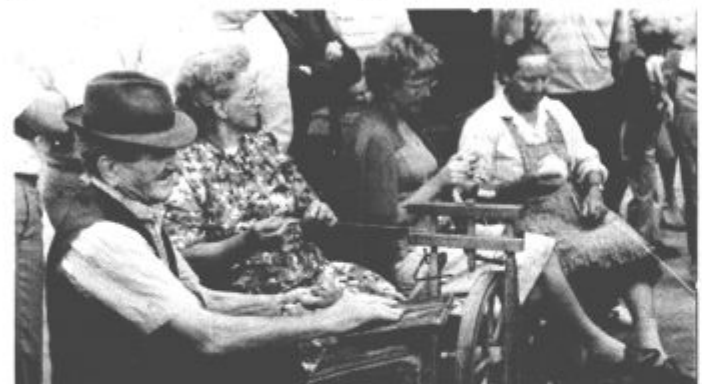
Čar turizma na vasi je tudi spoznavanje nekdanjih običajev

Tudi sicer je bilo še marsikaj zanimivega. Velemojster Bruno Parma je odigral vsakoletno simultanko in petnajstim tekmečkom oddal vsega tri remije, v rokometnem maratonu pa so se pomerili mladi in stari. Po 24 urah utrjujočega igranja so bili skoraj »razumljivo« bolj mlajši, ki so svoje tekmece ugnali z rezultatom 663:630. Izkazali so se tudi ribiči, ki so za vse ljubitelje ribolova pripravili tekmovanje in seveda nagradili tistega srečneža, ki je ulovil največjo ribo. Za vsakogar nekaj in še več torej, sicer pa nasvidenje prihodnje leto.