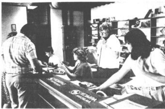
Kompasova turistična agencija je v Rdeči dvorani

Seveda nas je ob našem obisku v turističnih agencijah zanimalo tudi, če pomagajo turistom, ki prihajajo v naše okolje. Na tem področju je le malo narejenega in tudi naša turistična ponudba je skromna. Seveda v obeh agencijah gostom svetujejo, kaj si je na našem območju vredno ogledati, začeli pa so pripravljati tudi programe za takšne goste. Kompas dela prve korake na tem področju v sodelovanju z Zdraviliščem Dobrna, v zadnjem času pa se pogovarjajo tudi s predstavnikmi Zdravilišča Topolšica, da bi tudi za njihove goste pripravljali izletniške in zabavne programe.