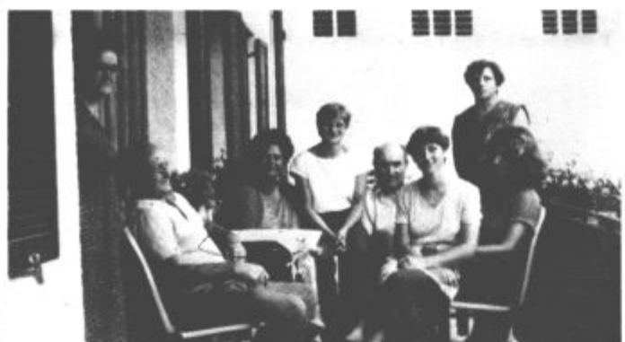
Gostje in gostitelji so ena sama družina, kar največ velja

Zgornjesavinjska kmetijska zadruga je nosilec kmečkega turizma na preusmerjenih kmetijah, zato se z zmanjševanjem, neupravičenem postopu, njegovega pomena ne more sprijazniti. Usmeritev je jasna — vsestransko krepiti kmečki turizem še naprej in ga spodbujati, vendar na njegovih resničnih vsebinskih pravih. Popuščati ne mislijo, in tako je edino pravilno.