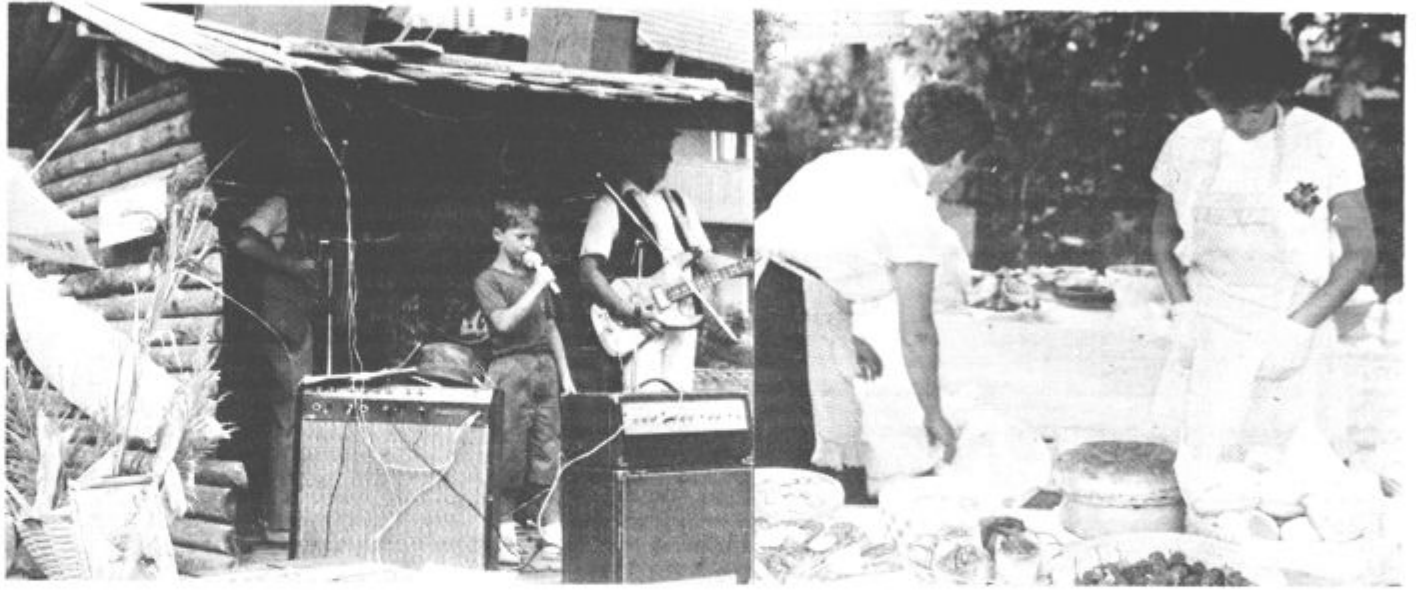
V LUČAH JE BILO LEPO — V tem prijetnem in lepem kraju so v nedeljo v okviru znanega Lučkega dne znova pripravili prireditev »Od štanta do štanta«, lani izbrano za najboljšo turisti-

čno prireditev v Sloveniji. Luče so bile tudi v nedeljo pravi narodopisni muzej »v živo« in obiska najbrž nikomur ni bilo žal, sicer pa več o tem na strani 4.