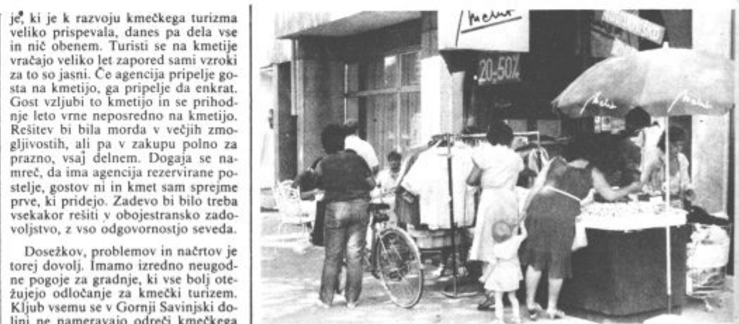
PRODAJA NA PROSTEM — Pri Modnem salonu v središču Titovega Velenja, so se letos drugič odločili prodajati svoje izdelke kar na prostem. Kot so povedali, je med mimoidočimi kupci za to vrsto prodaje precejšnje zanimanje.

To je daleč od izvirmih vsebinskih načel kmečkega turizma, za katere smo se odločili že na začetku in se jim v nobenem primeru ne mislimo odreči. Naš cilj je čisti stacionarni turizem z lepo naravo, mirom, domačnostjo, spoznavanjem življenja in dela na kmetiji in na vasi. Izletniška oblika ne pride v poštev, še manj gostilniška, ki s kmečkim turizmom nima nobene zveze. Seveda je izletniška oblika bolj donosna in manj zahtevna, toda to ni in ne bo naš cilj. Stacionarni turizem zahteva od vse kmečke družine, ne le od gospodinje, veliko žrtve, odrekanj in naporov. Gostje se večinoma vklju-