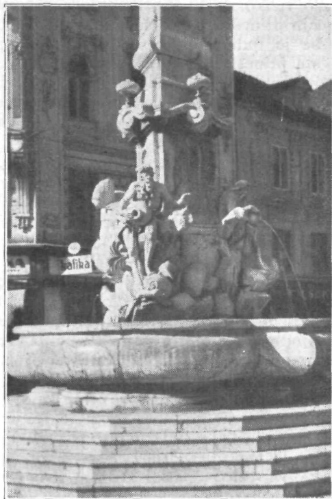
Robbov vodnjak pred magistratom

Že je prišel čas, ko poleta šolska mladina iz mesta na deželo, a ona iz dežele v mesto. Lepo je v mestu in na deželi, vendar si vsak želi majhne izpremembe vsaj za nekaj ur. Ni ga skoraj kraja brez kakih posebnosti, ki tujca zanimajo kakor domačina. Ta kraj se odlikuje po svoji prirodni lepoti, oni zopet po svojih zgodovinskih spomenikih. Posebno mladina iz dežele kaj rada poleti v glavno mesto naše banovine, v belo Ljubljano.