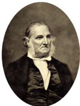
Audubon v zrelejših letih