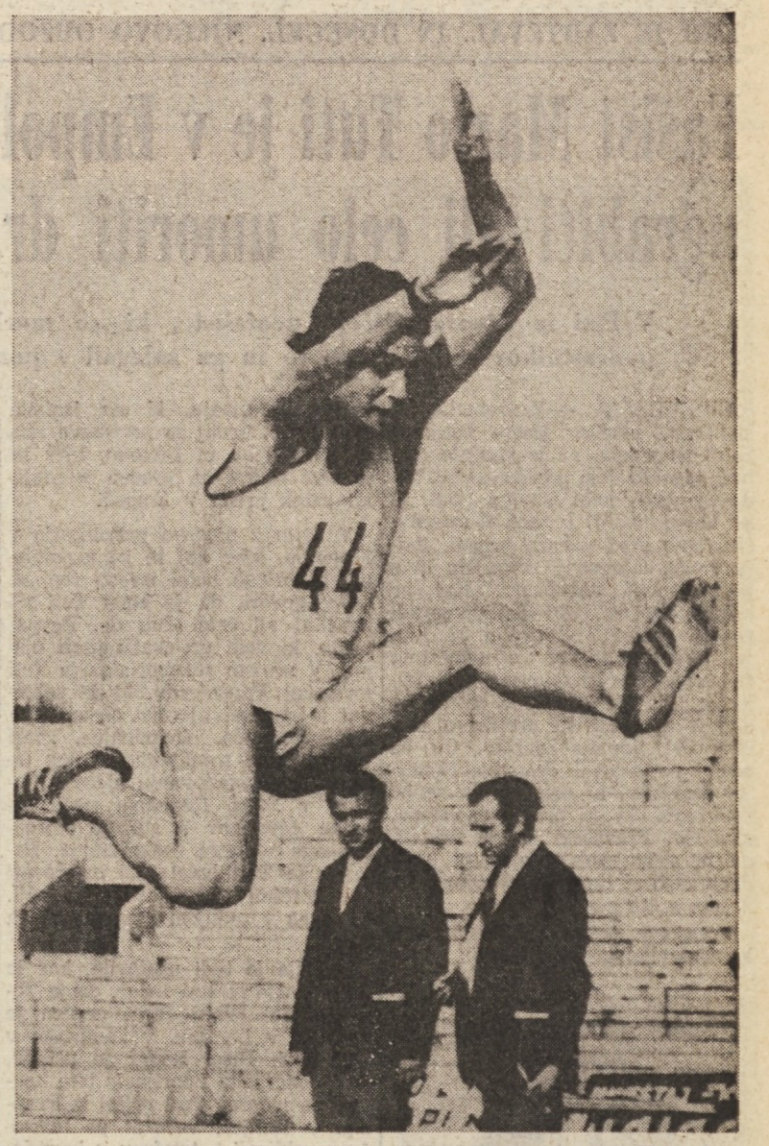
Tako skače v daljino Nenad Stekić, novi evropski rekord. V kratkem bo svojo formo preveril na balkanskih igrah v Romuniji

Pred kratkim je izgledalo, da pojeva premoc playolase Annelie Erhardt v teku na 100 m tež ovire. Olimpijska prvakinja je bila nekajkrat porazena od Poljakinje Grazne Rybszyna, sedaj pa se je tudi Erhardtova vrnila k nekdanjim časom in dvoboj v Nici obeta tek na zelo visoki tehnični ravni.