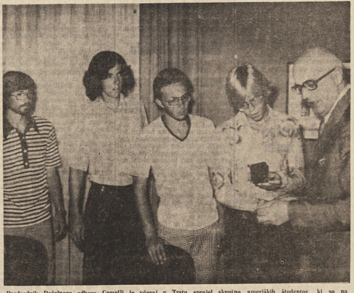
Predsednik Deželnega odbora Comelli je včeraj v Trstu sprejel skupino ameriških študentov, ki so na študijskem potovanju v Furlaniji - Julijski krajini. Ameriški študenti so gostje agencije SNIA iz Torviscoso. Med srečanjem so gostom prikazali osnovne smerice regionalnega upravljanja, predvsem pa ekonomske in socialne probleme Furlanije - Julijske krajine