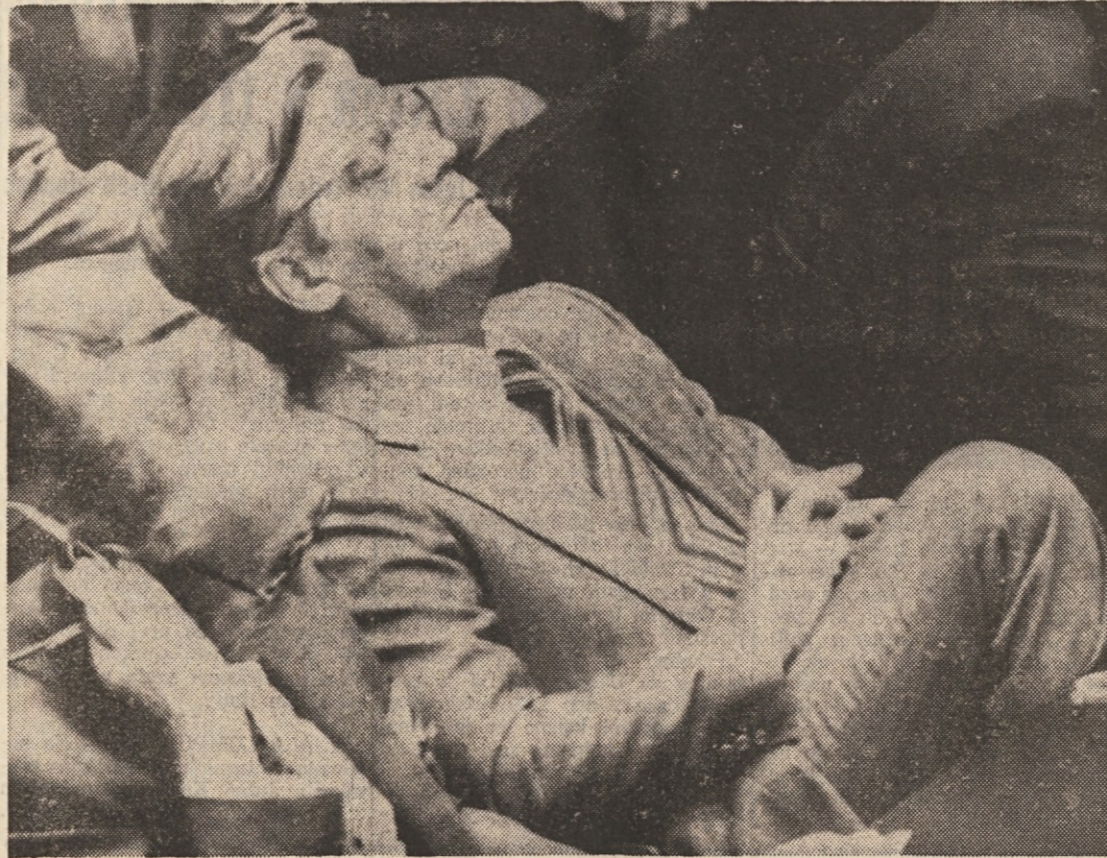
Kljub zanimivosti evropske konference o varnosti, je zahodnoevropskega kanclerja Helmuta Schmidta obšla dremavica. Očitno so ga strli večstranski pogovori z drugimi državniki in pripravljalo delo, ki je za kulislami potekalo do jutranjih ur