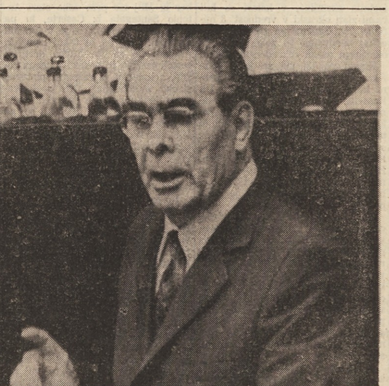
Sekretar sovjetske komunistične partije Brežnjev med svojim govorom na konferenci v Helsinkih

strijski politiki, ki bo sposobna, da prispeva k premostitvi sedanje recesijske krize in k preureditvi italijanskega proizvodnega sistema na osnovi novih naložbenih načrtov v elektriki, ladjestvu, kmetijstvu in živilski industriji. Sindikati sporočajo, da je minister za državne udeležbe zagotovil, da ne bodo sprejeli nobenega ukrepa o preureditvi podjetij z državno udeležbo, preden ne bodo uređili vprašanja Montedisona. Tudi o vprašanju Montedisona se bo minister pogovarjal s sindikati, obenem pa bo prihodnji teden sklical sestanek predsednikov vseh ustanov državnih udeležb za proučitev njihovih načrtov, da se poiščejo najboljše rešitve za večjo učinkovitost proizvodnje.