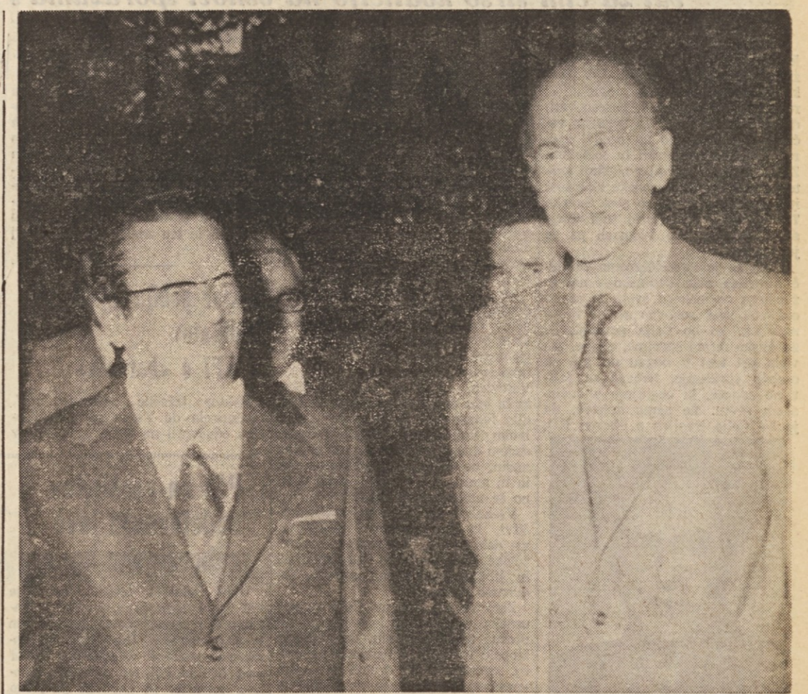
Ob robu konference o varnosti in sodelovanju v Evropi pride vsak dan do vrste srečanj med voditelji raznih držav udeležencev, ki jih uradna kronika konference večji del niti ne omenja. Najbolj zanimivo je bilo srečanje med ameriškim predsednikom Fordom, francoskim predsednikom Giscardom d'Estaingom, britanskim premierom Wilsonom in zahodnonemškimi kanclerjem Schmidtom. Sestala sta se tudi jugoslovanski predsednik Tito in predsednik Francije Valery Giscard d'Estaing, ki ju vidimo na sliki