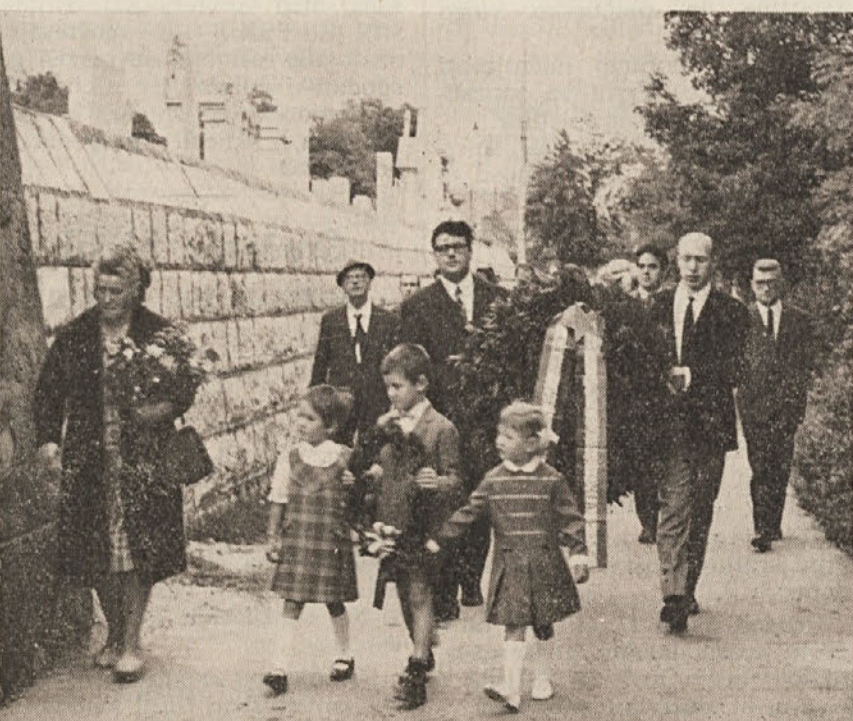
Slovenska prosvetna društva so praznovala 25-letnico vseljudske vstaje proti fašizmu. Te proslave so bile združene s praznovanjem 100-letnice ustanovitve prvih slovenskih čitalnic na Tržaškem in Goriškem. Na prvi sliki; spominska proslava pred spomenikom v Rimanzijah. Podobna proslava je bila tudi na Opčinah (druga slika).