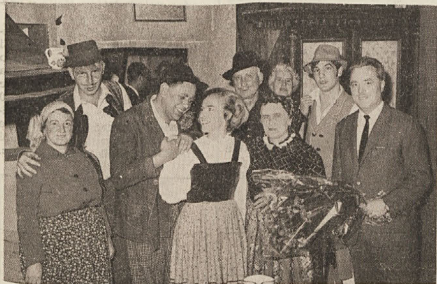
Člani openske dramske skupine. Igro «Pepče se ženi» bodo Openci ponovili v nedeljo, 13 oktobra ob 17. uri.