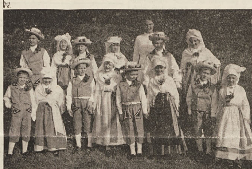
Z nedeljskega slavlja prosvetnega društva Slavec v Ricmanjih

Ob stoletnici ustanovitve čitalnice je prosvetno društvo Tabor izdalo brošuro, v kateri je opisan zelo pomemben del zgodovine vasi. Društvo je tudi primerno prenovilo dvorano in nabavilo nove zavese. V načrtu je še ureditev spominske razstave.