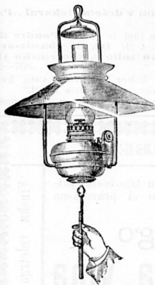
Dunajska bliskovna svetilnica 30'''