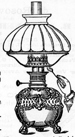
Mizna svetilnica z brilantnim meteornim svetilcem

Vse steklene stvari, ki so potrebne za petrolejske svetilnice, — v največjej izberi.