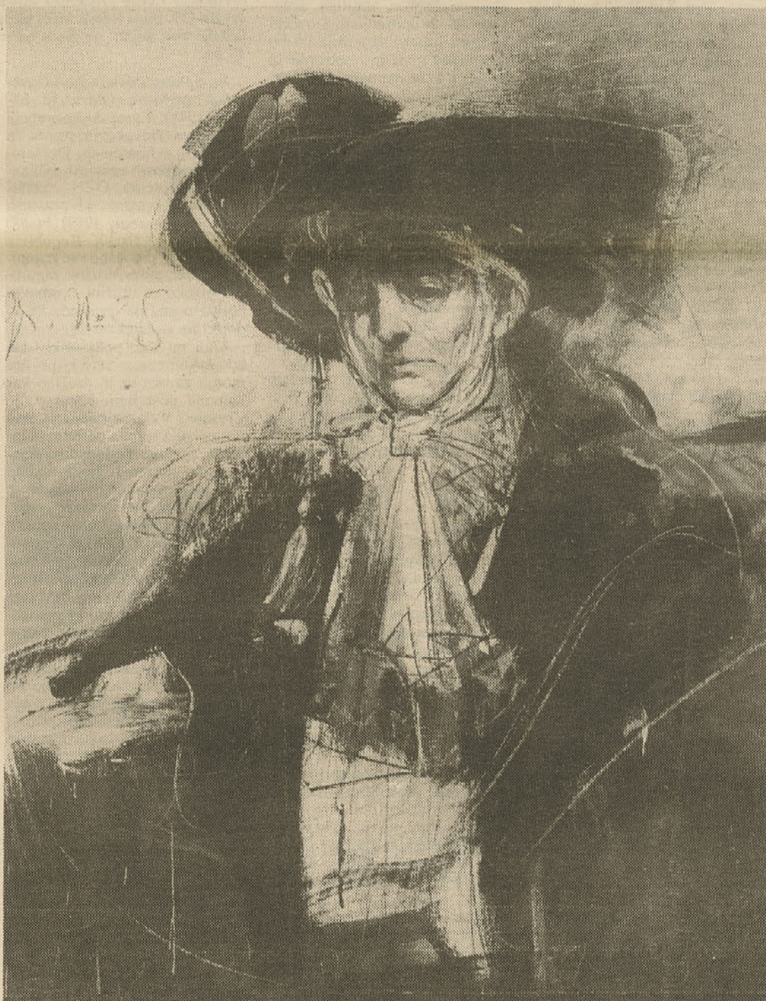
Bard lucundus: Mladi Chardin, 1981

Tokrat objavljene slike so s posmrtno razstave del Barda Lucundusa, ki je bila odprta od 14. maja do 8. junija v prostorih Mestne galerije.