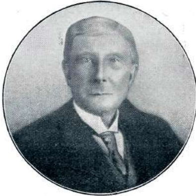
ALFRED ROCKEFELLER najbogatejši mož na svetu

Timrava je prišla v slovaško književnost kot dovršen talent; o njej se ne more reči: v tem spisu se začenja njen razvoj in v onem se že kaže kot dovršena pisateljica. Vsi njeni spisi so dobri in predvsem izvorni. Timrava ima svoj način opisovanja, svojo dikcijo, ki