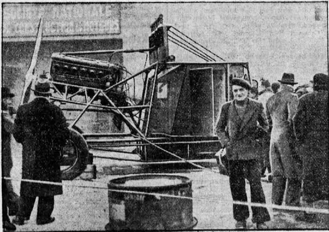
Letaske motorje prepeljejo na Montblanc

ši. Najprej se je film imenoval: »Tri male miške«. Gotovo zelo zanimivo in vablivo, vsaj za Amerikance. Ljudje sprva res niso vedeli, ali nastopajo v filmu res male miške, ali pa ne. In ta dvom je za filmska podjetja velike važnosti, saj ravno zaradi tega pride film gledat mnogo teh ljudi, ki so v dvomu, kakšne miške naj bodo to. Toda, rodil se je pomislek, če morda ne bodo ljudje smatrali filma za nemoralnega. Zato so se odločili, da se mora film imenovati drugače, čeprav dosedanj naslov ni bil ravno tako malo vabljev. In tako so predlagali nova imena: »Lov na moške«, »Sola za lov na moške«, »Podeželska dekleta v mesto« ali pa »Tri velike dame«. Nazadnje pa so se le zedinili, da je še vedno najboljša, če se film imenuje v bodoče »Lov na moške«. To bi pri taksem občinstvu, ki hodi v Ameriki v kino, pomenilo še vedno nekaj silno zanimivega in bi vleкло. Ta naslov prvič ni predolg, drugič mnogo pove in je nazadnje tudi od silne poučen, tako mislijo v Ameriki. Pričakujejo, da bo imel ta film zdaj še večji uspeh kot prej, vsaj finančni, če ne več.