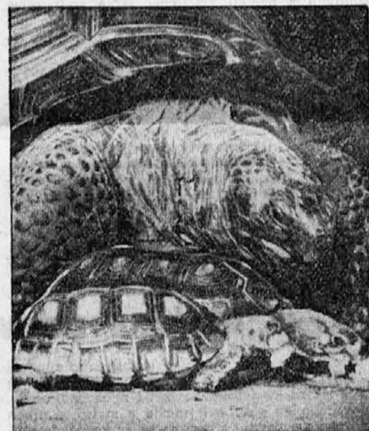
80 let stara velikanska želva gleda izpod svojega »klobuka« na mlado, urno braziljanko, kako ji pred nosom odnaša hrano. Starost tu nima prednosti.