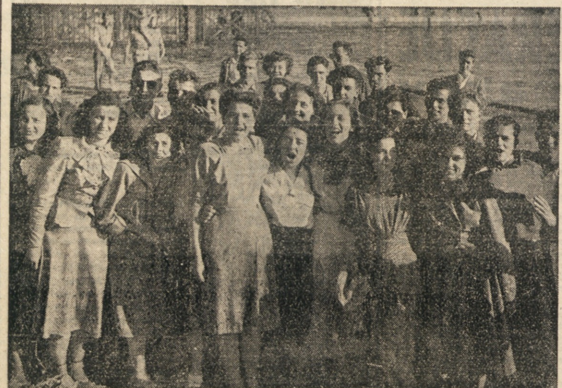
S PRVEGA KONGRESA DELOVNE MLADINE TRZASKEGA OZEMLJA