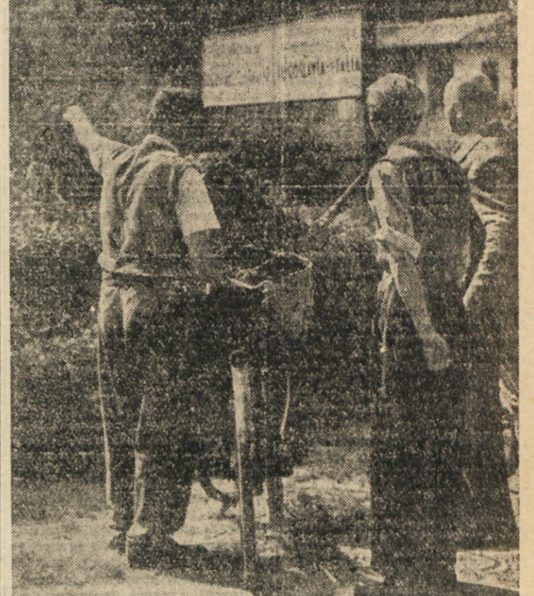
GOJENCI SLOVENSKE POMORSKO-TRGOVINSKE AKADEMIJE V PIRANU MED UČNO URO V NOVIH PROSTORIH

Na gradilišču Nove Gorice je bila v nedeljo 13. t. m. velika slavnost polovične pruge temelja Nove Gorice. Za ta slavnostni dan se je gorško ljudstvo v navdušenju pripravilo.