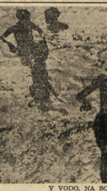
V VODO, NA SONCE, NA ZRAK...