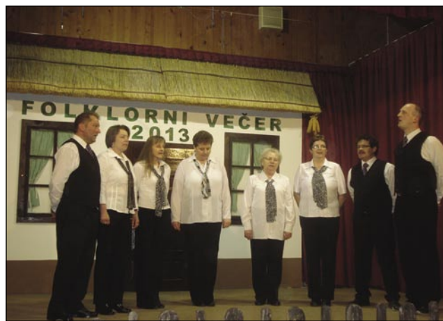
Ljudski pevci Slovenske zveze z Gorenjoga Senika na odri na Cankovi