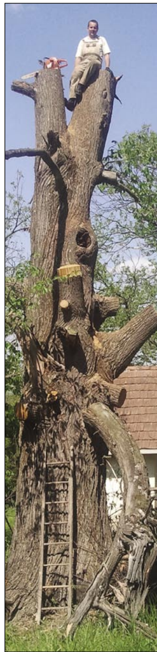
Peti se dostakrat najde v nevarnom položaji. Na debli stare drevje z motorno žago

»Leko povejm, ka sem v gauštji gorraso, pa zato, ka z lesaum delati je lejpo delo. Nega ešče ednoga tašoga materiala, šteroga bi na telko vse leko goraponücali kak lejs. Brezi lesa bi ranč živeti nej mogli, zato ka bi nej bilau oksigena.«