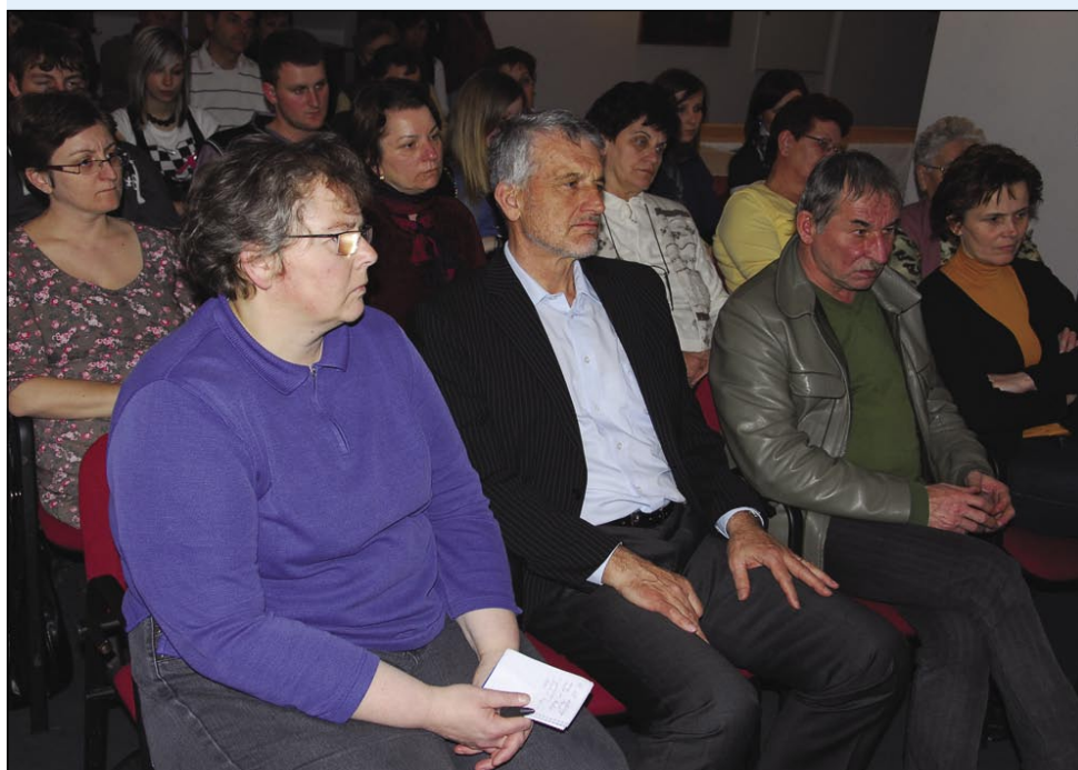
Za publiko so se zbrali mladi pa starejši tő