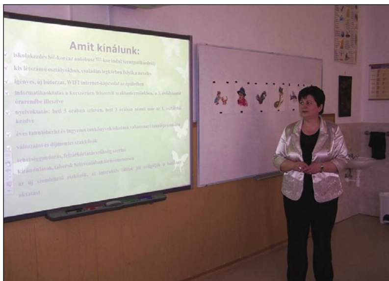
Dvojezičnost je naša šansa – pravi ravnateljica

morejo mlajši na 8.10 priti. Včijo se po mali skupinaj v držinskoj atmosferi, majo nauwe stole pa stolice« - je povödala ravnateljica pa cüjdala, ka se mlajši informatiko že od 3. razreda dale včijo. Vozovnice za avtobus pa šaulske knjige dobijo vsi šenki, leko pa nutstaupijo v vsefélé krožke (spejvanje, gledališče, folklo-