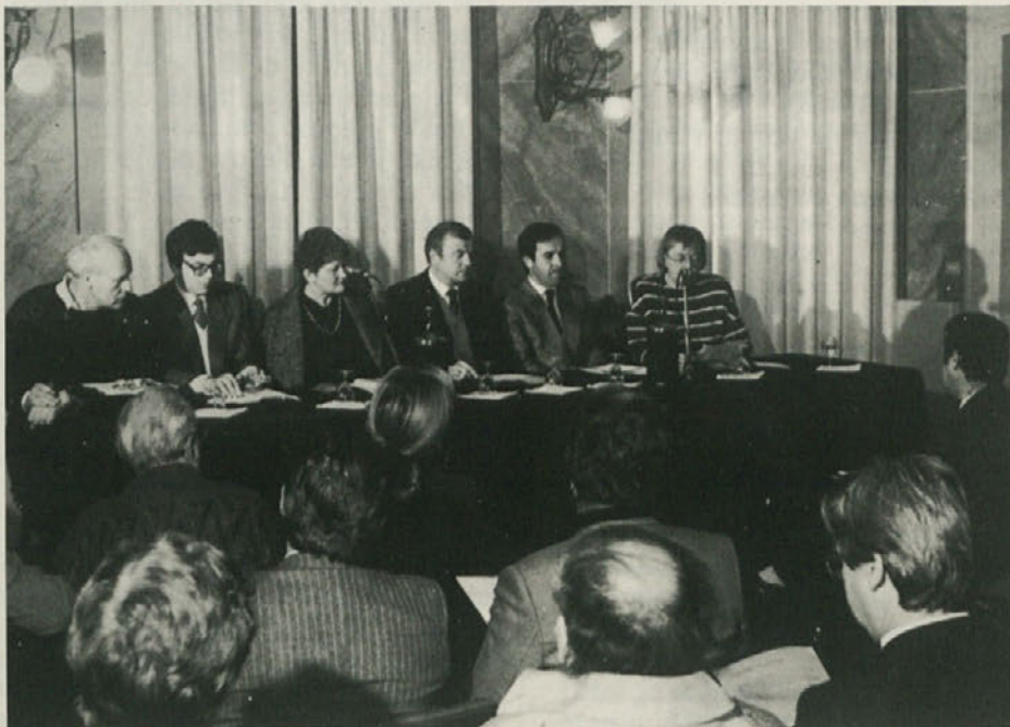
Organizacije beneških Slovencev so prejšnji ponedeljek priredile v Vidmu tiskovno konferenco, da bi obrazložile njih stališče o vladnem «finančnem zakonu». O tem bomo še poročali.

Manos je odšel v Nikozijo, Kristina pa se je vsak dan vozila v bližnjo Larnaco. Brat je dobil delo v nikozijski banki, zaslužil je dovolj, saj je Nikozija, potem ko se je položaj pomiril in ko je državljanska vojna izbruhnila v Libanonu, Bejrut zamenjala kot finančni center vsega Bližnjega vzhoda. Manos je pogosto potoval v Saudsko Arabijo, Dubaj, Doho, Dhahran, Bahrein, pa tudi London in Frankfurt. Delu mu je šlo lahko od rok, bil je bančni posrednik, v omenjenih mestih si je ustvaril lepe zveze. Postavil si je hišo južno od Nikozije, daleč od razmejitvene Attilove črte. Tam je bilo bolj varno, ustvaril si je družino. Od vse njegove družine je morda še najmanj trpel, začel je lahko popolnoma na novo. Kristina je naredila daktilografski tečaj v Nikoziji, ostala v naselju, se še naprej učila in redno hodila na delo v Larnaco, kjer se je zaposlila v nekem ladjarskem predstavništvu.