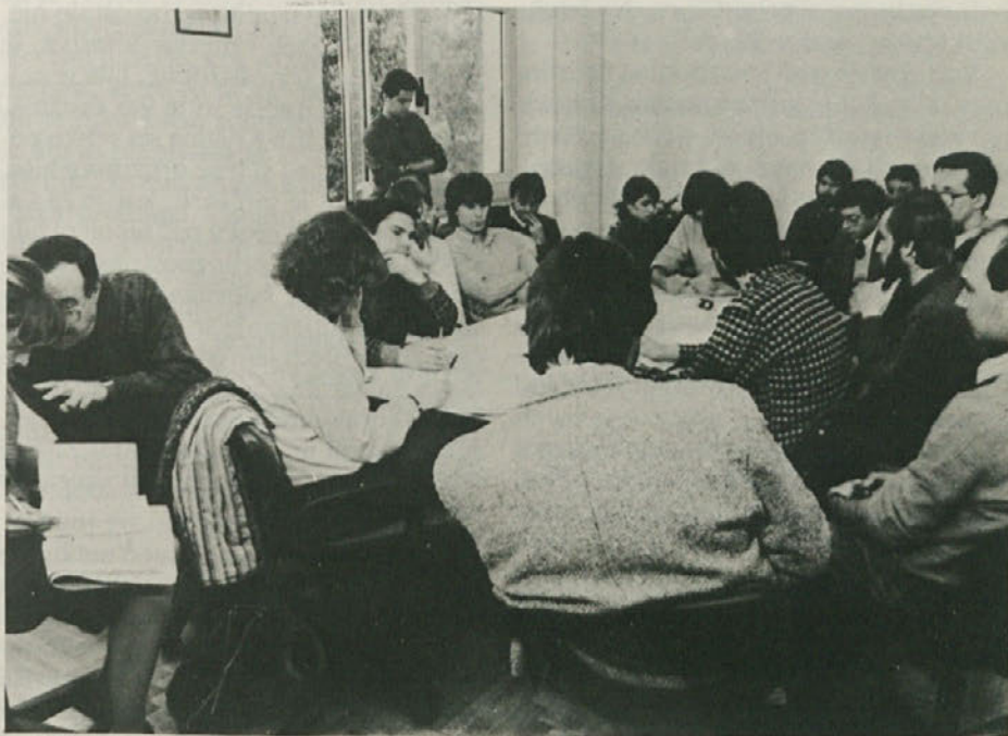
V četrtek 5. novembra sta ZKMI in ZSMS priredili tiskovno konferenco, da bi predstavili skupno resolucijo mladinskih skupin in organizacij o jedrski energiji. K dokumentu je že pristopilo kar nekaj organizacij.

Medtem je Manos ostal v Atenah. Letalo na Nikozijo je imel vsak dan štirikrat, toda bil je iz revne kmečke družine in za vazovnico več kot enkrat letno ni