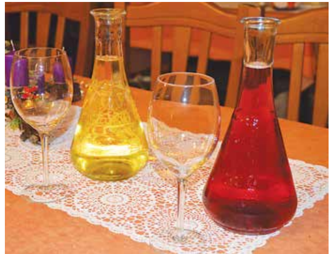
Mlado belo in rdeče vino