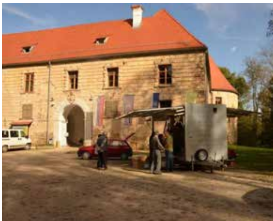
Stiskanje soka pred gradom