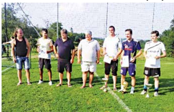
Razglasitev najboljših na turnirju