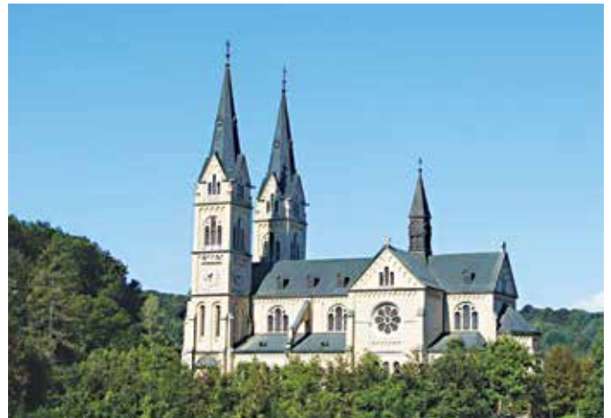
Cerkev Lurške Matere Božje v Brestanici

Ob začetku pastoralnega leta smo imeli dve romanji. 6. septembra je bilo vseškofijsko romanje v Ludbreg, kjer smo doživeli peto srečanje slovenskih in hrvaških vernikov. Romarski kraj je znan po tem, da je v grajski kapeli leta 1411 med mašo duhovnik podvomil v resnično Jezusovo navzočnost pod podobama kruha in vina. Takoj po spremenjenju se je vino spremenilo v kri. Duhovnik je posodico s krvjo dal vzdati v glavni oltar in je šele pred svojo smrtjo razodel čudežni dogodek. Takoj so začeli prihajati številni romarji. Relikvija je bila pozneje nekaj let v Rimu. Papež Leon X. jo je večkrat v procesiji nosil po mestu. Leta 1513 je izdal posebno bulo, s katero je dovolil javno češčenje. Relikvijo so vrnili v Ludbreg, kjer so ob češčenju predragocene Kristusove Krvi zaznali milostna srečanja med človeškim in Božjim. Po bogatem dogodku nas je pot vodila še naprej v največje Marijino hrvaško romarsko središče Marijo Bistrico.