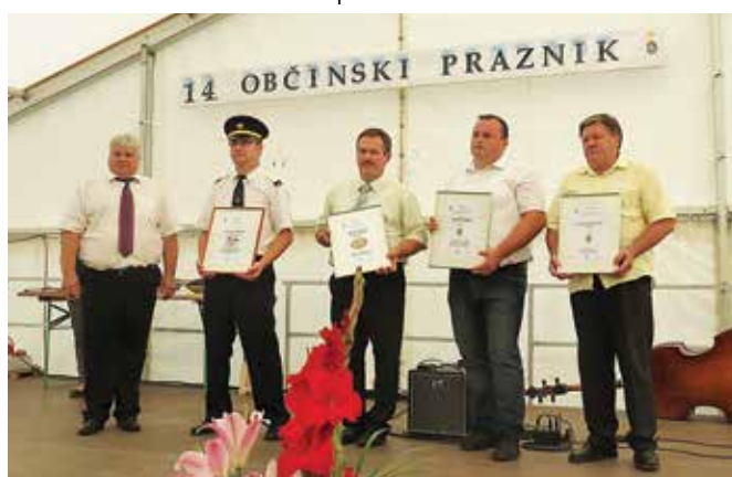
Prejemniki zahvalnih plaket