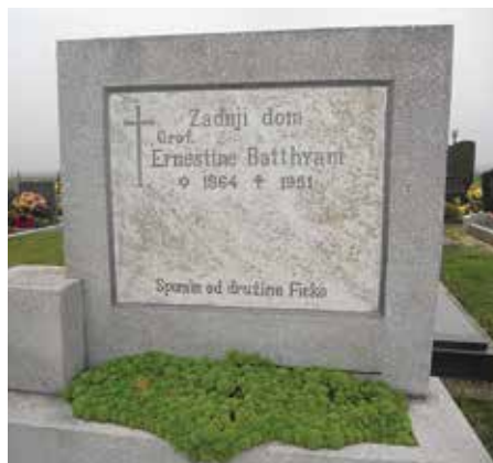
Zadnje počivališče »gračke kontese« na Krajni

»Poljanska grofična«, kot so jo kasneje poimenovali, se je tako po vojni in po odvzemu še drugega doma bila prisiljena zateči k dobrim rokam domačinov s Krajne. Ko je bilo njeno premoženje nacionalizirano, je zadnja leta svojega življenja preživela pri družini Ficko na Krajni. Ta je po njeni smrti v zameno za oskrbo dobila vsega skupaj 5 hektarjev zemlje od skupnih 200 hektarjev. Tako je »gračka kontesa« na stara leta ostala brez doma, brez denarja in brez družine. A kot pravijo domačini na Krajni, je tudi v starosti izgledala še vedno urejena, nališpana in »poštimana« kot prava grofica do konca svojega življenja. Zato je še danes na Krajni ostal frazem, da če se katera ženska v vasi čudno nališpa, izgleda kot »poljanska grofica«.