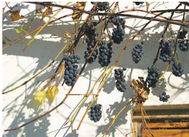
Jurka še danes krasijo nekatere stare domačije

Najstarejša hibridna sorta vinske trte naj bi bila po pripovedovanjih othelo, kasneje so prišle še druge samorodnice kot so delaware, šmarnica, izabela, klinton idr. Šmarnico, jurko, klinton, francoza in izabelo najdemo še na marsikaterih brajdah po Goričkem, ponekod zasajene tudi kot gorice. Nekaterim bolj služijo za prijetno senco ob poletni vročini, drugi pa še vedno pridelujejo vino iz njih za svoje lastne potrebe, za sok, marmelado, vino. Jurka ali črni nemec je sorta, ki jo najdemo pri nas predvsem na brajdah, uspeva povsod in je široke rasti, zato je priljubljena zaradi sence, ki jo daje. Ima srednje velik grozd in debele temno modre jagode z debelo kožico, sok je rdečkast. Daje zelo aromatično vino, njeno grozdje pa se rado uporablja za sokove in zadnje čase tudi za marmelado.