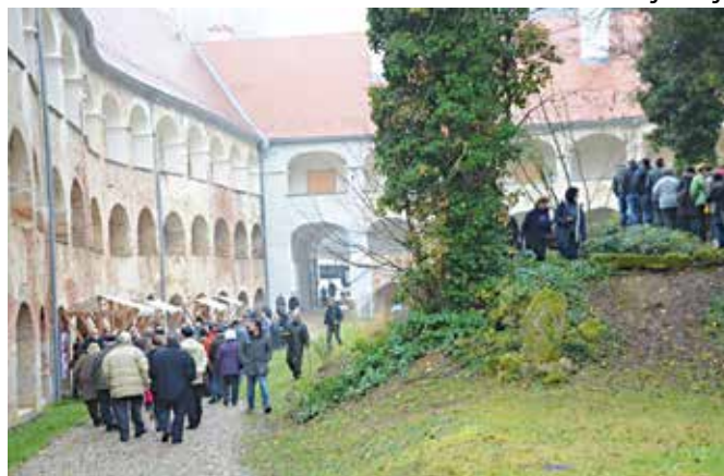
Na Andrejevem sejmu na gradu