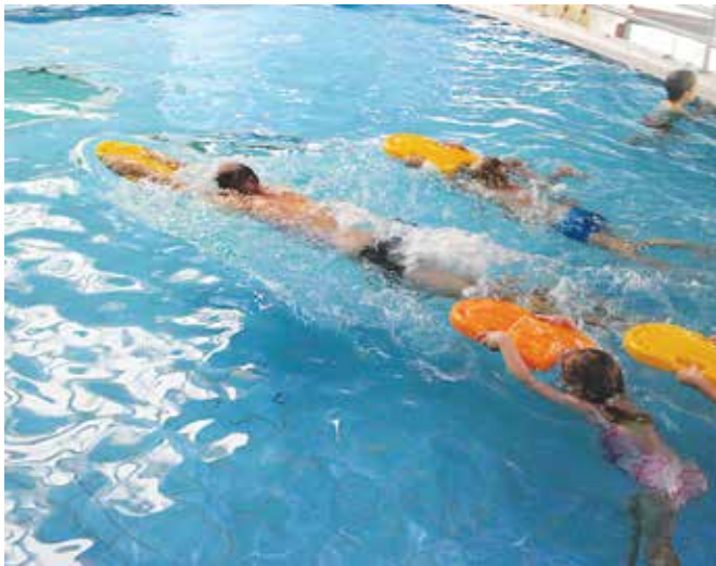
Na plavalnem tečaju