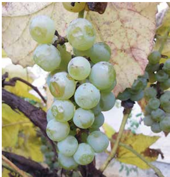
Šmarnica je najbolj razširjena samorodnica