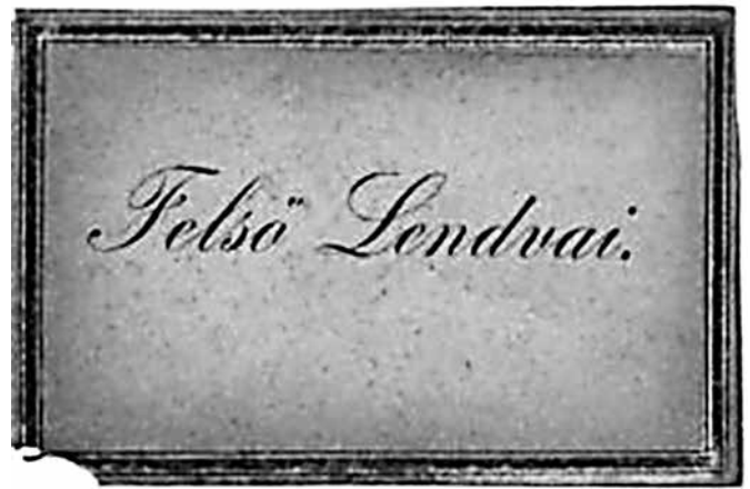
Etiketa za vino, polnjeno na Hartnerjevem posestvu Gornja Lendava