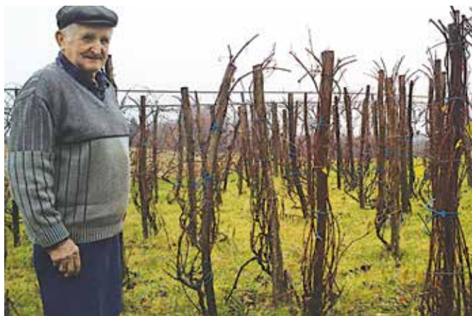
Gorice, kakor so bile nekoč. Prvi štiri trsi so »pogrobani« z ene korenine