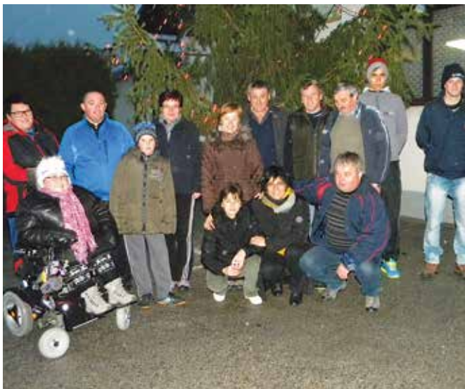
Člani ŠRD Dolnji Slaveči ob postavljeni jelki

30. novembra 2014 smo se prebudili v precej megleno jutro. Ni bilo belih snežink, ki bi nas lahko popeljale v adventni čas. Kljub vsemu je čarobnost adventa potrkala na vrata. Med ljudmi se je razvejala toplina in har-