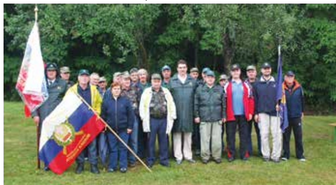
Pohodi so priljubljena dejavnost veteranov