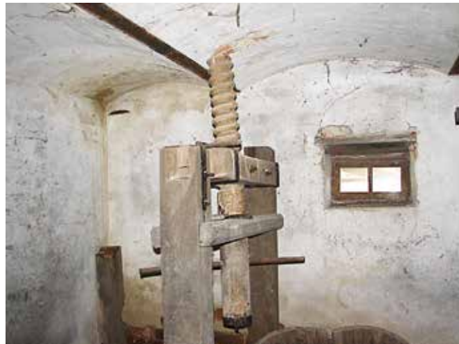
Del stare preše z domačije v Kovačevcih