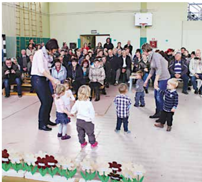
Otroci so nastopili pred babicami in dedki