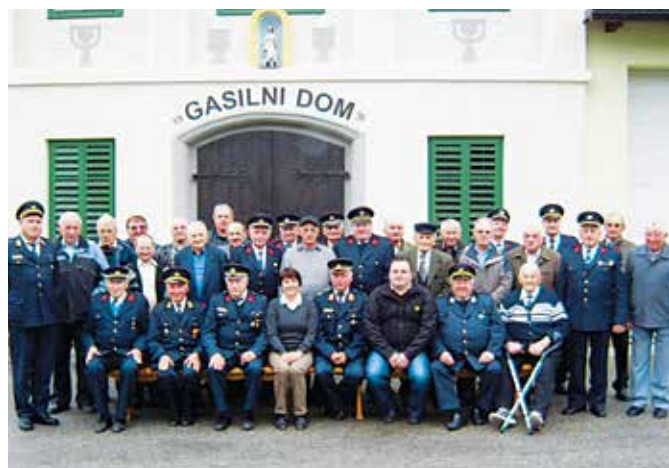
Srečanje gasilskih veteranov

Za potrebe operativne dejavnosti se je tudi letos nabavila nova oprema kot je izpihovalnik dima ter radijske ročne postaje, del iz proračuna Občine Grad del pa preko MORS-a, izpostava M. Sobota.