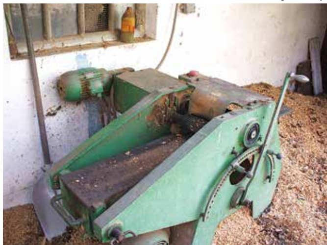
Sodarski debelinski skobelni stroj