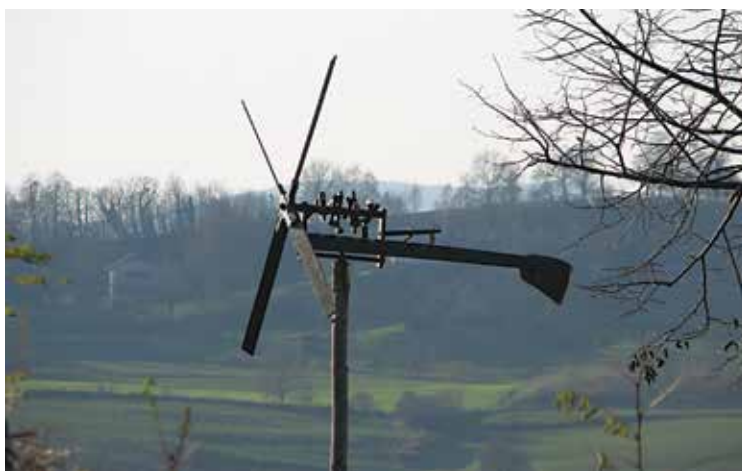
Pred bratvo je utihnil tudi klopotec