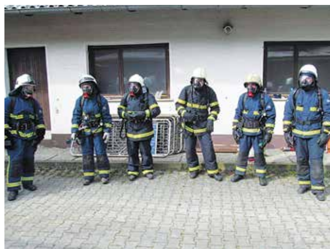
Praktične vaje v Vidoncih

Za vse operativne člane in članice so zelo pomembne tudi gasilske operativne vaje. Teh žal ni bilo zadosti, nekaj po gasilskih društvih ter ena skupna v organizaciji GZ Grad, ki je potekala po vnaprej določenem scenariju, po elaboratu in soglasju občine Grad v naselju Kruplivnik. Na vaji so sodelovala vsa PGD GZ Grad s skoraj vsemi gasilskimi vozili in opremo, vključno z ReCO M. Sobota. Cilj in namen vaje je bilo preverjanje postopkov vodje intervencije, delo z gasilsko tehniko in opremo, pravilna komunikacija vodij enot z vodjo intervencije ter ReCO itd. Vaja je bila uspešno izvedena in zaključena. Na vaji, ki je potekala v zgodnjih jutranjih urah, je sodelovalo 66 operativnih članov, s skoraj vsemi gasilskimi vozili, ki jih imamo v GZ na razpolago. Sklep analize vaje potrjuje, da je potrebno izvajanje določenih vaj po PGD in na nivoju GZ okrepiti!