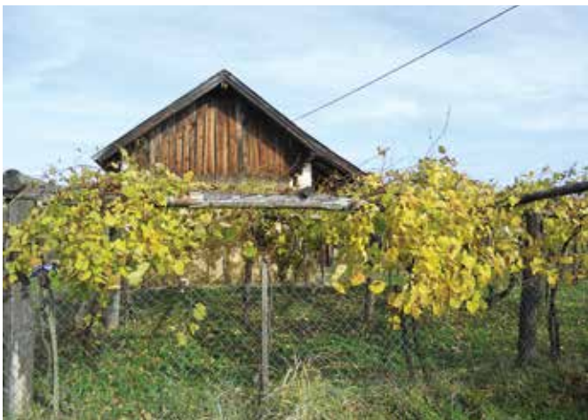
Zapuščena domačija pri Gradu v objemu domače brajde

Katere vrste trsov so torej sadili v naših krajih, kako je to delo potekalo in kje je bila za njih najboljša ugodna lega? Zanimala nas je tudi pravilna nadaljnja vzreja te rastline, saj kot vemo, je bila ta skozi čas podvržena tudi raznim boleznim in navsezadnje tudi pticam zobarkam. Ni slučaj, da se je tudi v naših koncih moral pojaviti klopotec. A osrednji praznik je bil in je še dandanes dan trgatve ali bratve. To je praznik, na katerega se je moral pripraviti tako »vert« kakor gospodinja. Se je morda delo in jelo z leti kaj spremenilo?