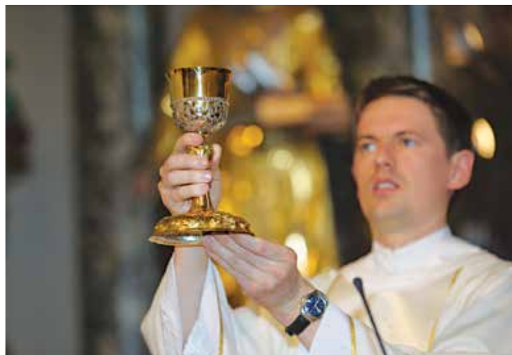
Posvetitev vina