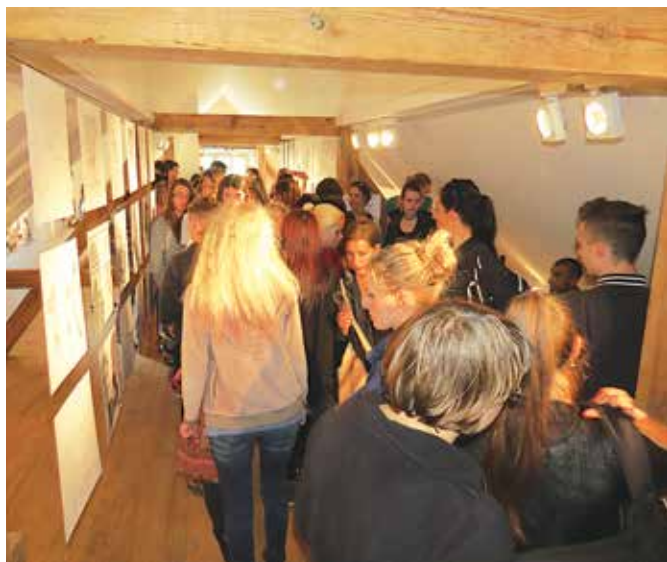
Dijaki so razstavili risbe z detajli mlina in gradu