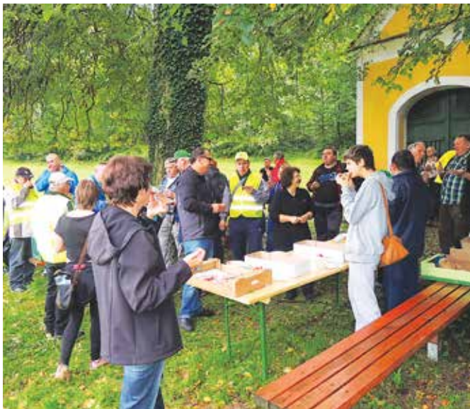
Pohodniki so se okrepčali ob Marofski kapeli