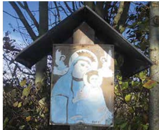
Domnevno razpelo s križem izven vasi Sieldorf/Žetinci