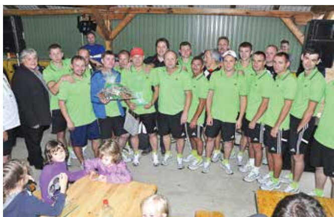
Podelitev priznanj