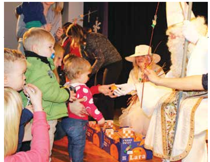
Miklavž je obdaril otroke