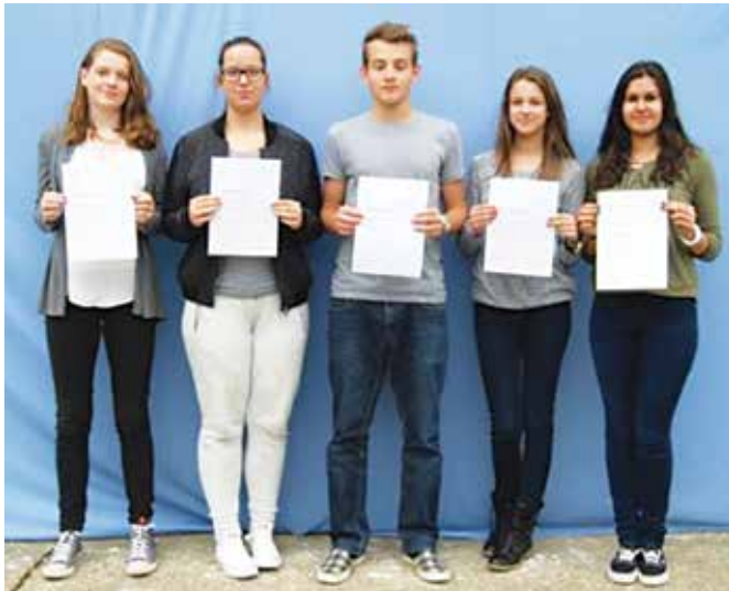
Naši učenci na podelitvi priznanj ob evropskem dnevu jezikov