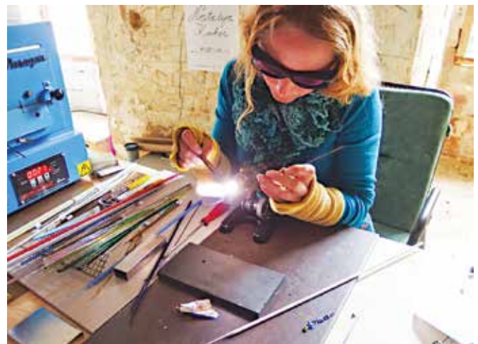
Oblikovanje steklenega nakita s fuzijsko obdelavo