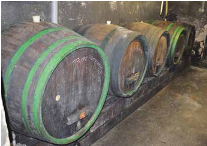
Vino zori v sodih

danes pa so na voljo druge oblike sodov, predvsem iz nerjavečega jekla. Bistrost, barva, vonj, okus in harmonija vina pa nam povedo, kakšna je stopnja zrelosti vina.