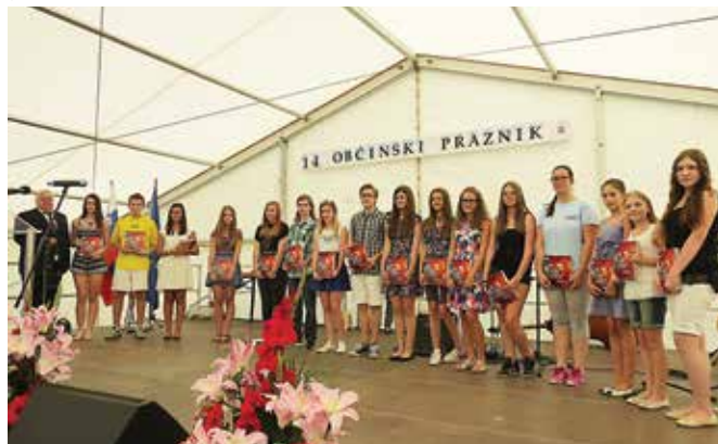
Uspešni učenci s prejetimi knjigami

Občina Grad je 8. avgusta praznovala 14. občinski praznik. Slavnostna seja je potekala v nedeljo, 10. avgusta, pri Osnovni šoli Grad.