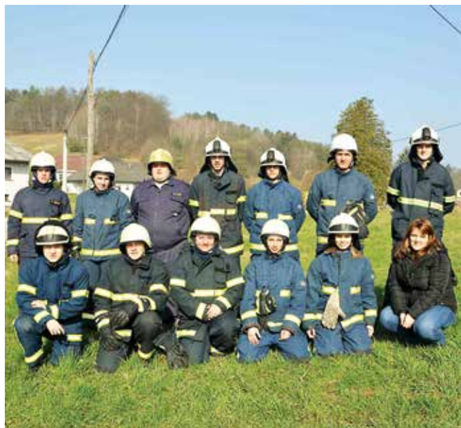
Članice in člani z uspešno končanim tečajem

podnevi, ko je 90% operativnih gasilcev v službah izven svojega požarnega območja, kar je tudi velik problem za redno zagotavljanje požarne varnosti preko dneva. Res pa je, da imajo ta problem tudi vsa ostala društva širom Slovenije.