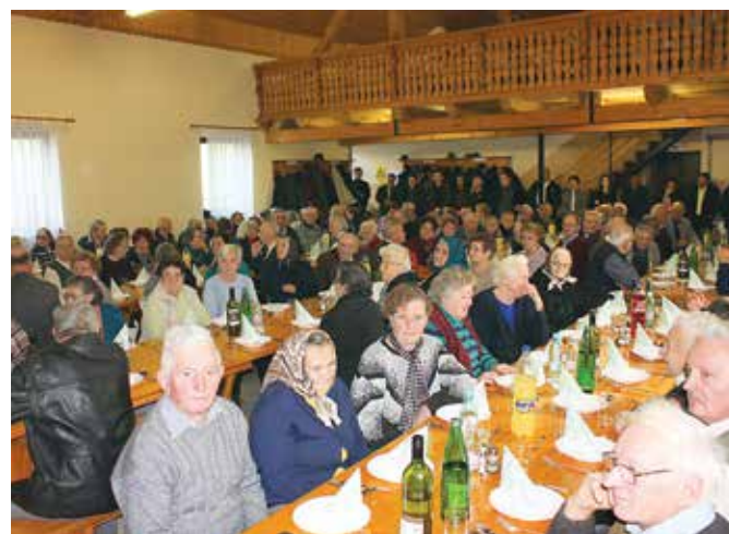
Starejši občani so na srečanju veselo poklepetali

Za kulturni program so poskrbeli učenci OŠ Grad. Po uvodnem pozdravu in pevsko-plesnem programu je