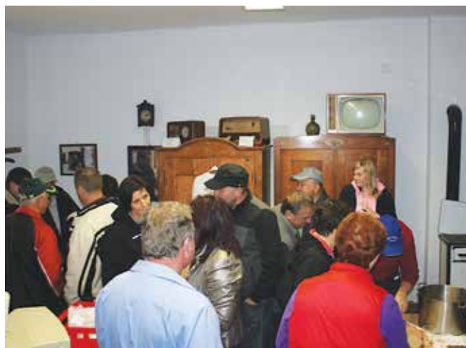
Druženje in pokušina domačih dobrot v info pisarni