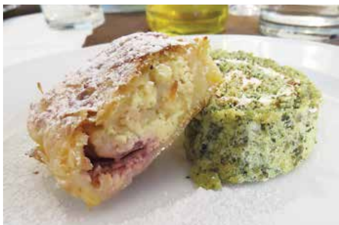
Delavce so poleg domače hrane pričakali tudi retaši