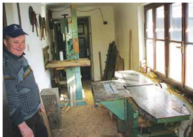
Tračna žaga in hobl mašina družine Šadl

Ljudje so se najbolj številčno odločali za izdelavo sodov, kar izdelujejo še danes, v preteklosti pa še za izdelavo kadi, škafov in lokavnice. Najbolj zahtevno delo je bilo zagotovo izdelava sodov.