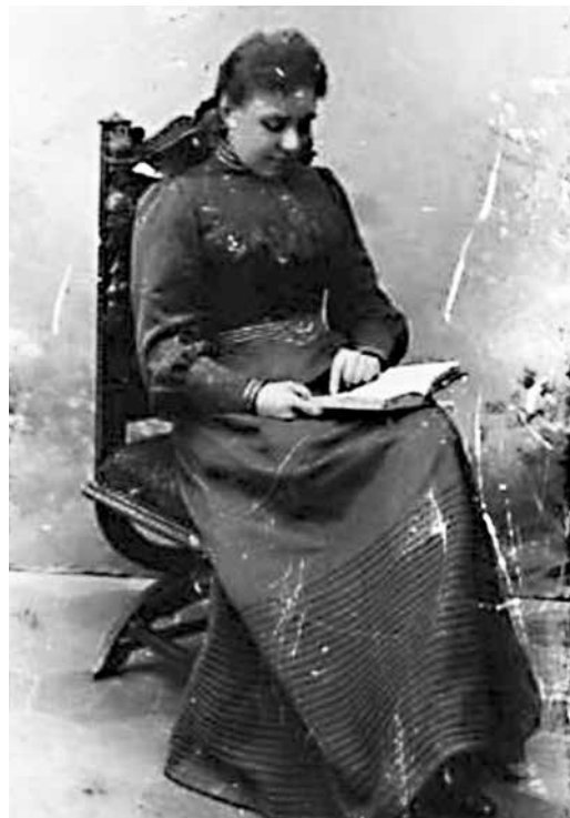
»Gračka kontesa« v mladosti med branjem knjige

Družina Batthyány, iz katere je izvirala »gračka kontesa«, je v Prekmurju igrala pomembno zemljiško gospodo. V naše kraje je prodirala iz takratne Madžarske, natančneje iz Zala-Szent-Gróta (severozahodno od Blatnega jezera). Tamkajšnjo posest je družina