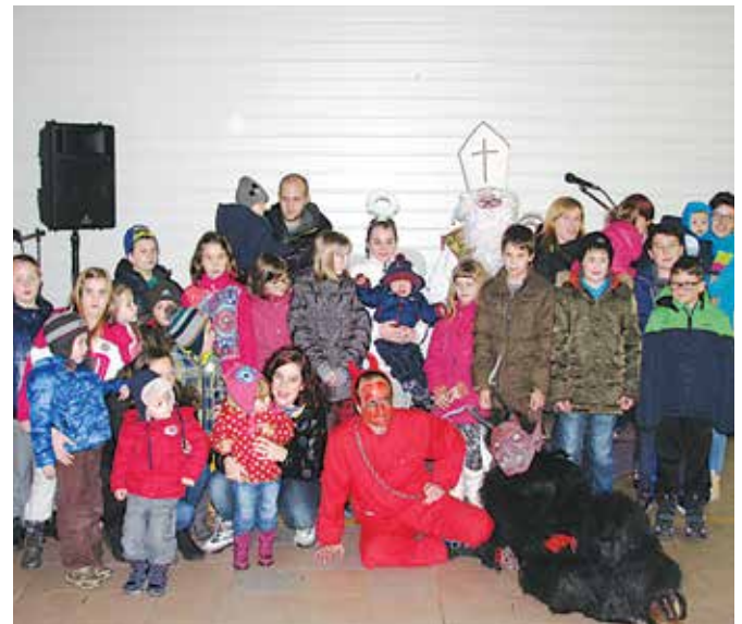
Otroke je obiskal Miklavž

Nedelja popoldne. Zamegljeno turobno vreme. Datum 7. 12. 2014. Čakamo na prižig novoletne razsvetljave. Napetost je v zraku. Strah se stopnjuje. Otroci so pred okni. Spremljajo dogajanje zunaj. Ob 17. uri pa se raje umaknejo v mamino naročje. Takrat se po Motovilcih sprehaja Miklavž. In parklji.