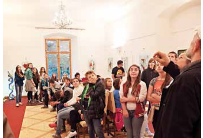
Učenci z navdušenjem poslušajo zanimivosti o steklu