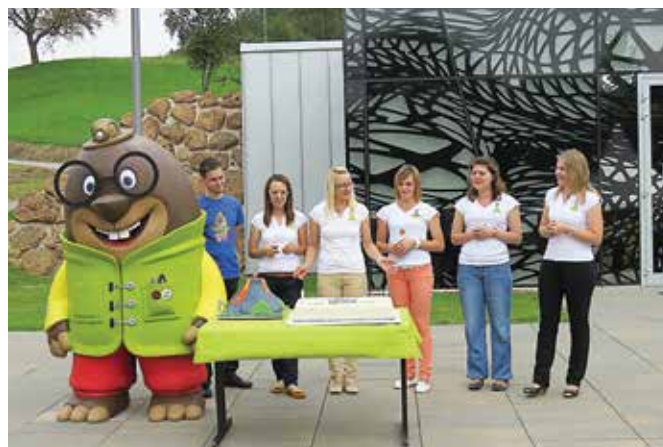
Prvi rojstni dan Vulkanije smo praznovali ob torti velikanki