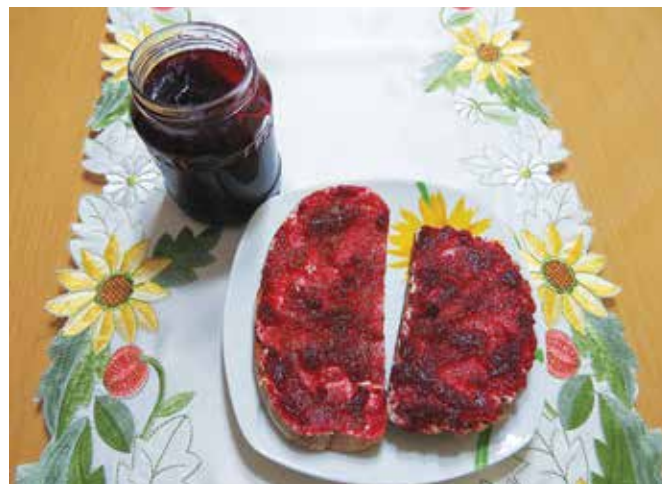
Marmelada iz jurke in jabolk