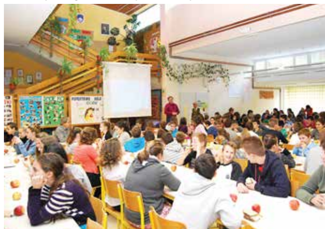
Učenci zajtrkujejo tradicionalni slovenski zajtrk

Tradicionalni slovenski zajtrk je osrednje dogajanje Dneva slovenske hrane, ki ga je razglasila Vlada Republike Slovenije in ga obeležujemo tretji petek v novembru. OŠ