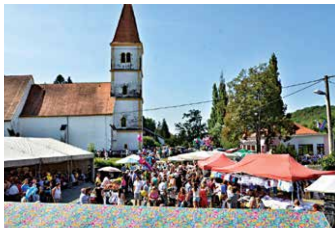
Preplavljena Pörga z množico ljudi

Tudi letos se je pred slovesnim praznikom ob oltarju gračke Marije začela tridnevna duhovna predpriprava,