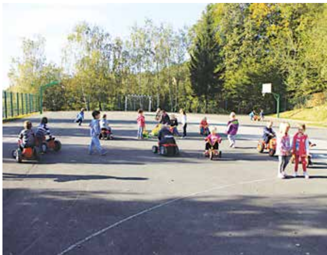
Obisk v vrtcu Mačkovci