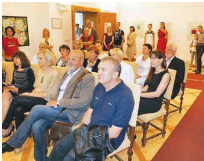
Otvoritev razstave Ars Vitraria