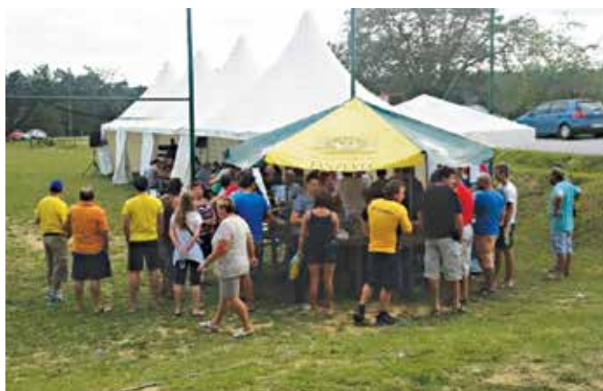
Na občinskih vaških igrah v Kovačevcih

Igre so potekale na igrišču Športnega društva in udeležile so se ga društva iz občine. Z veliko smeha in zabave so se tekmovalci borili v petih igrah, vmes kako popili in se zabavali ob zvokih glasbe. Po petih končanih igrah so na koncu zmagali domačini Kovačevci, drugo mesto so zasedli Radovci, tretji pa je bil Kruplivnik. A vreme tudi tokrat