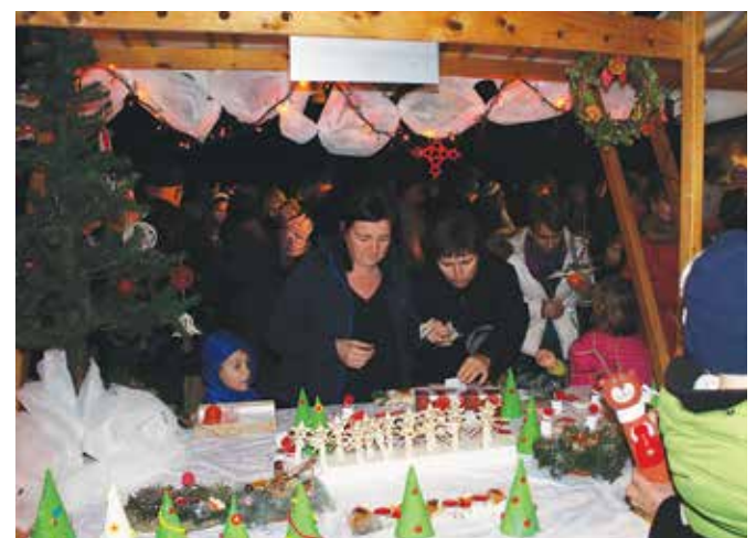
Stojnice so bile polne čudovitih božičnih izdelkov