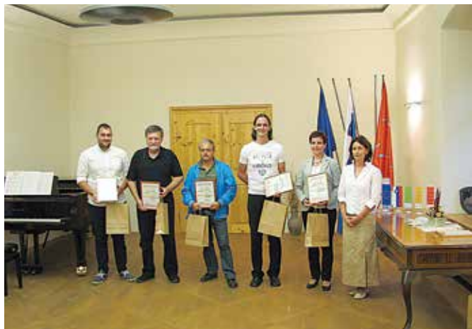
Prejemniki kolektivne blagovne znamke KPG