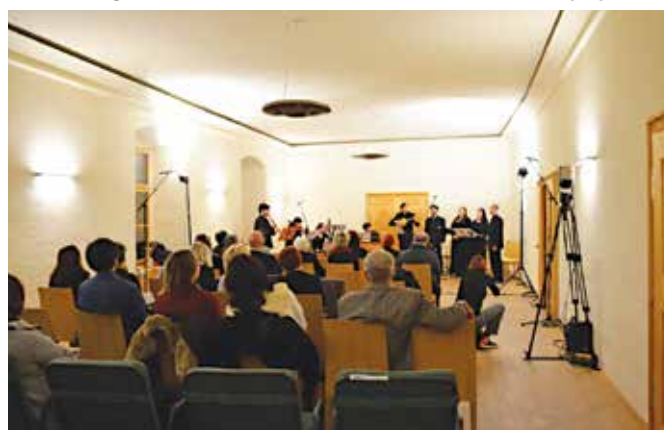
Koncert Seconda Pratica

Palimpsest je stran rokopisa, ki so mu izbrisali besedilo, da bi ga lahko ponovno uporabili. Recikliranje je bilo