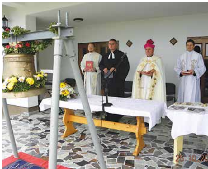
Blagoslovitev 100 kg težkega zvona v Kruplivniku