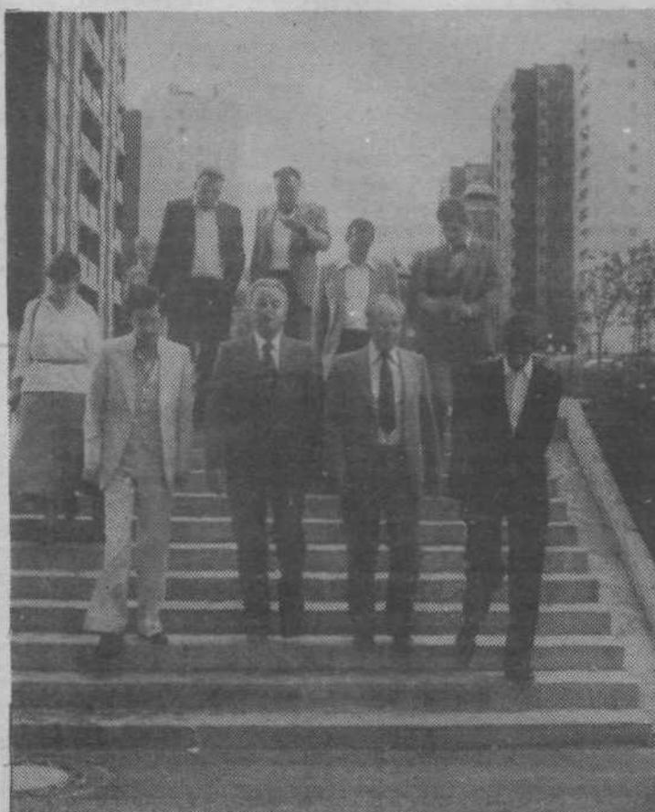
Predsednika zvezne konferenčne SZDL so krajanji popeljali po naselju.