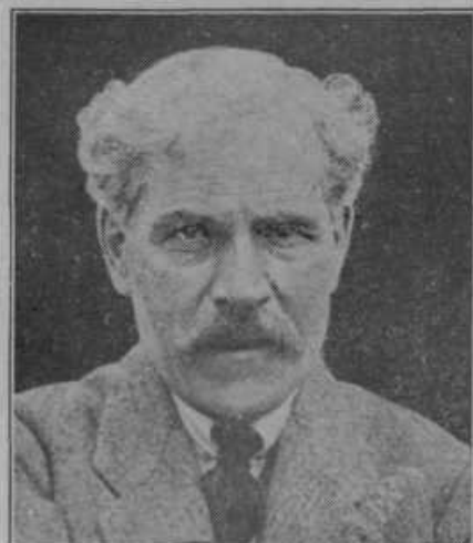
Macdonald, angleški min. predsednik.