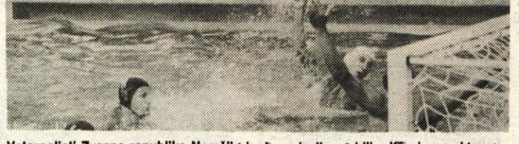
Vaterpolisti Zvezne republike Nemčije in Jugoslavije so bili v Kranju na sklepni pripravi pred olimpiado v Seulu. Odigrali so tudi nekaj medsebojnih prijateljskih srečanj. Posnetek je s sobotne tekme, ki so jo naši dobili z 11 : 10.

Agrokomerca na Celovski 43 v Ljubljani Med špekulacijo in korupcijo stran 4