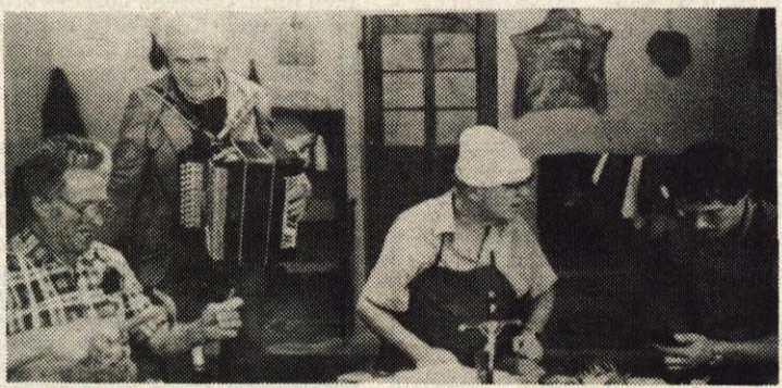
Tržič, 3. in 4. septembra - Minuli konec tedna je bil Tržič v znamenju čevljarkega praznika. Prireditve so se začele že v petek zvečer z odprtjem razstave Ex-tempore, nadaljevale pa v soboto s praznovanjem petinosemdesetletnice tovarne Peko. Veliko Tržičanov se je zbralo na osrednji slovesnosti ob visoki obletnici Peka, obiskovalci od blizu in daleč pa so prišli v nedeljo na jubilejno 20. šušarsko nedeljo. Vsa pohvala gre tudi organizatorjem, tržiškemu Turističnemu društvu, ki so prireditve dobro pripravili.