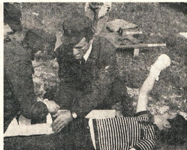
S tekmovalja ekip prve pomoči v Srednji vasi.

25. maja je prejelo izkaznico člana ZSMS 398 učencev iz kamniške občine. O tem, kakšna je zdaj njihova dolžnost do družbe, pa tudi pravice, so izvedeli že na predavanjih, ki jih je zanje pred sprejemom organizirala občinska konferenca ZSMS Kamnik.