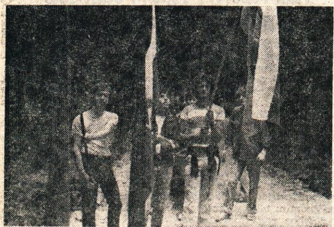
Naši mladi brigadirji