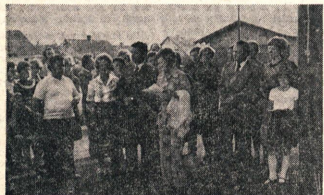
Z otvoritve nove poslovne enote kamniške podružnice Ljubljanske banke na Bakovniku