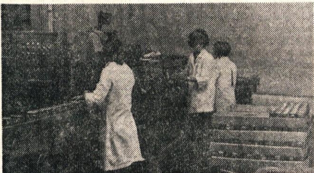
V ETI so že začeli s predelavo kumaric