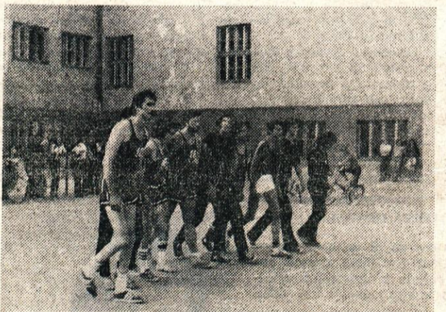
Kamniška košarkarska ekipa na Frbežar-Mrakovem memorialu