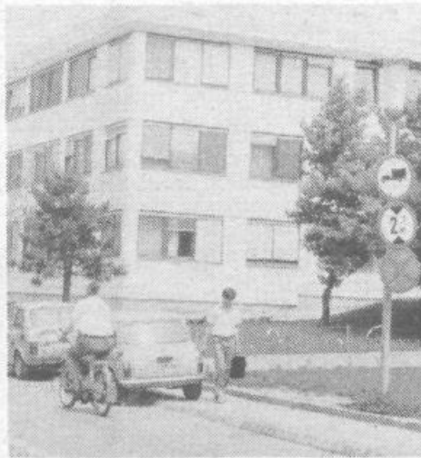
Ulice in pločniki ob zdravstvenem domu in njihova (pre)zasedenost z avtomobili

Fotografije, ki smo jih posneli na ulicah okrog zdravstvenega doma na Viču, povedo več, kot zmore zabeležiti pisalni stroj. Prva in osnovna lastnost večine naših prebivalcev – voznikov – je postala: »Pomembno je, da imam jaz prostor za parkiranje in, da bom storil čim manj korakov do cilja.« Pravičnost ravnanja, upoštevanje zakonskih določil, razmerje do drugih voznikov in pešcev je izbrisano iz voznike in človeške etike.