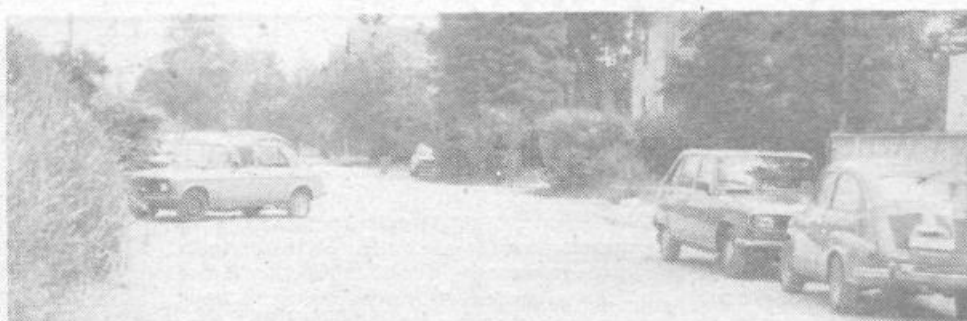
Parkirišče za zdravstvenim domom Vič