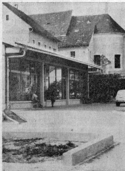
Nova trgovina na Rečici

Samoodpovedovanje članov kolektiva in krediti, katere je »Savinja«