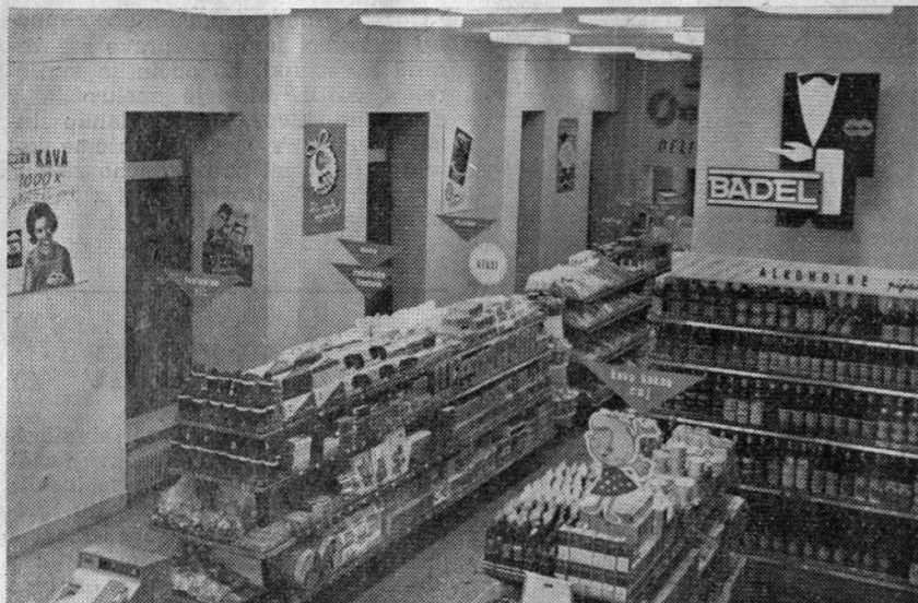
Samopostrežba v Mozirju

Kolektiv trgovskega podjetja »Savinja« nudi v vseh svojih prodajalnah več vrst potrošniških kreditov, s katerimi omogočajo potrošnikom nakup skoraj vseh vrst blaga. Še zlasti opozarjamo na to, da nudijo kredite zasebnim kmetijskim proizvajalcem za nakup kmetijske mehanizacije.