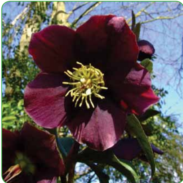
Teloh najlepše uspeva v polsenci, v rahli odcedni in s humusom bogati zemlji.

scille, žafrani in zvončki. Čeprav so pomladni cvetovi zelo dobrodošli, bergenije gojimo predvsem zaradi njihovih velikih zimzelenih listov, ki so v vrtu okras vso zimo. Na sončnih legah je njihova vloga podobna, kot je vloga host v senci. Cvetovi so v grozdastih socvetjih v beli, rožnati ali