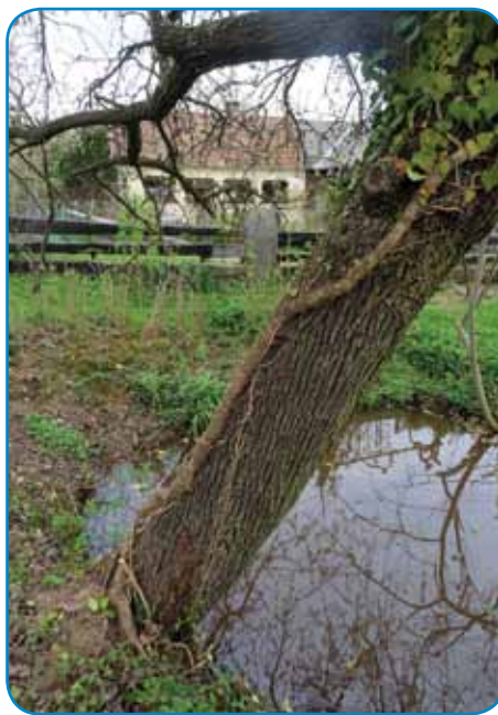
Gnauksvejta je vsakša porabska iža mejla svojo mlako