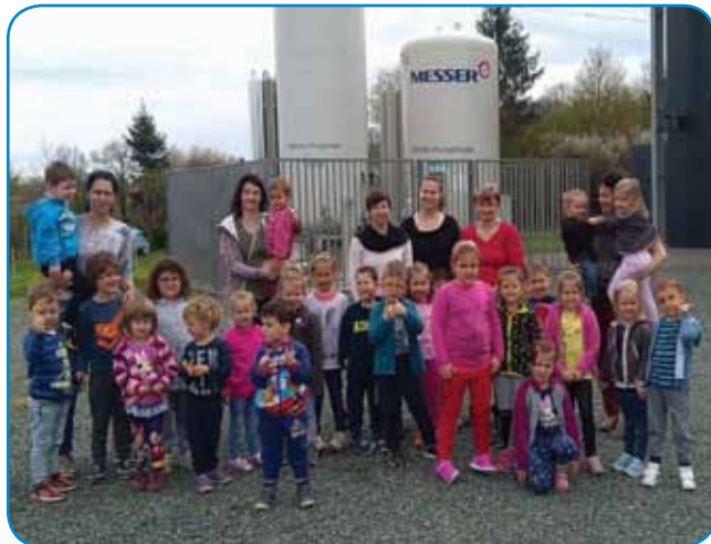
Sakalovski in dolnjesejniški malčki z vzgojiteljicami in varuškami pred podjetjem RABACSA na Dolnjem Seniku

V torek, 17. aprila 2018, smo z vrtcema Dolnji Senik in Sakalovci obiskali podjetje Rabacsa, ki se ukvarja z obdelovanjem in