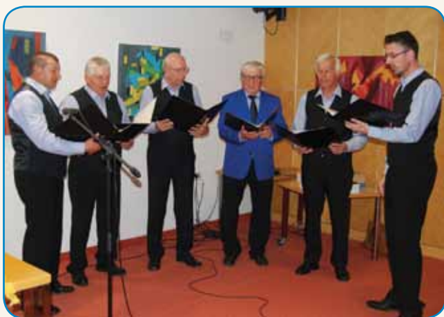
DOSTAKRAT JE BIU V ŠAULI CEJLI DEN stran 4