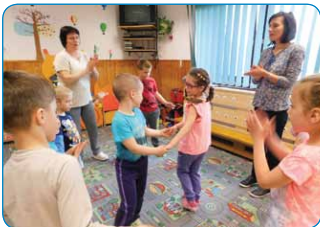
Malčki se pripravljajo tudi v Števanovcih

to glasbo in tako, da poleg izgovorjave slovenskih besed vadijo tudi občutek za ritem. Zveza Slovencev na Madžarskem bo zadnji teden maja organizirala Teden otroka z naslovom »Pika poka pod goro ...«.