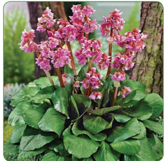
Cvetovi bergenij so uporabni tudi kot rezano cvetje. Listi pridejo do veljave celo v posodah in koritih.

se potrebujejo v nasprotju z majhnimi čebulnicami veliko več hrane. Za gnojenje uporabimo hitro topna gnojila, ki