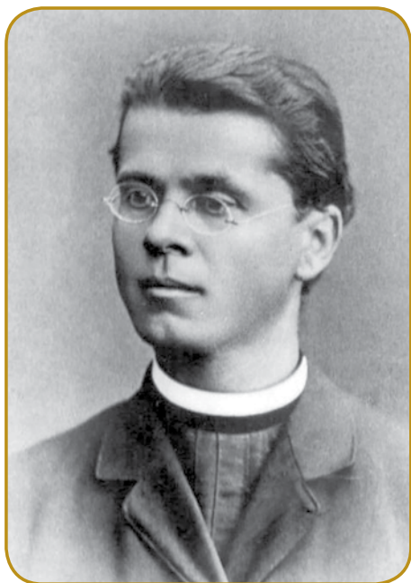
Simon Gregorčič se je naraudo blüzi varaša Kobarid pri reki Soči - po krajini ga zovémo »goriški slavček«

bezenski roman, vejpa pripovejda o lübezni med mladim škonikom Louretom Kvasom pa gračkov čerdjauv Manicov . Pripovejst »desetoga brata« Martineka Spaka , njegovoga očó pa paubrata je prilika romantičnoga romana z motivom maščevanja (bosszú) sina nad očó. Jurčiči se je prišikalo vküpprinesti žitek na gradi pa na vesi, komat vönavčene pa špajsne veške lidi, kmične premi-nauče pa svejkle zdajšnje čase.