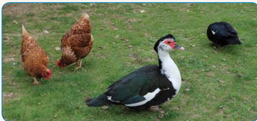
ZVEKŠOGA SEM DOMA stran 8