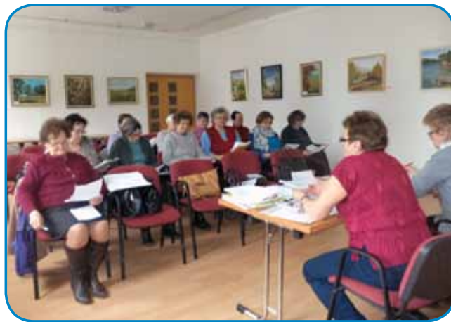
Prvi djilejš v Slovenskom daumi

tau zaslužijo naši penzionisti. Tau tū dobro vejmō, ka v društvu mamō več lidij, steri so meli tašno službo, ka bi leko vodili društvo, bi se razmeli na potrebno administracijsko delo, pejnaze spravlati z natečaji tak doma kak iz Slovenije, samo se abajo. Dja v svojom imeni vö smejm prajti, ka