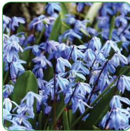
Scilla z zvezdastimi sinjemodrimi cvetovi, ki so lepi v spomladanskih majhnih šopkih.

se potrebujejo v nasprotju z majhnimi čebulnicami veliko več hrane. Za gnojenje uporabimo hitro topna gnojila, ki