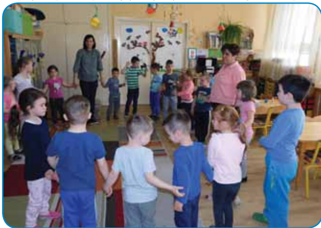
Slovenska skupina monoštrskega vrtca

Letošnja tema sodelovanja Zveze Slovencev s porabskimi vrtci je ohranjanje in negovanje otroških ljudskih pesmi. Porabski malčki se s svojimi vzgojiteljicami in asistentkami iz Slovenije že od začetka leta pridno učijo novih otroških ljudskih pesmi in plesov ter skupaj rajajo. Pri petju in plesu si pomagajo z igranjem na otroška glasbila, s posne-