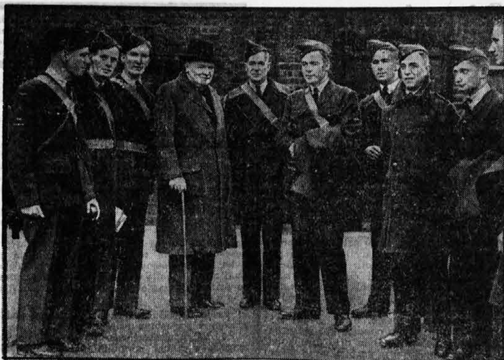
Angleški mornariški minister Churchill »sovražnik Nemčije št. 1« med kanadskimi letalci

Kraljevina Švedska je prav za prav velesila Skandinavije in šteje blizu 7 milijonov prebi- valcev. Glavno mesto Stockholm je zelo moderno in veliko. Ogrorna večina prebivalcev je švedske narodnosti, nekaj malega je Rusov in na skraj- nem severnem delu države živi nekaj tisoč Lap- oncev. Tu so Švedski spremenili mesto Boden v velikansko trdnjavo. Pravijo, da je nezavzetna in v njeni okolici ima švedska kopna vojska vsako leto vaje. V državi nepismenosti ne poznajo, sploh pa veljajo Švedski za zelo omikane ljudi. Šte- vilne univerze, srednje in strokovne šole skrbijo za izobrazbo vseh državljanov. Prav tako so na