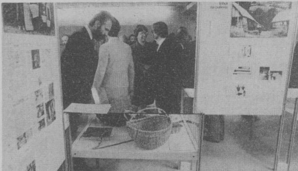
Ob 40-letnici revije Pionir je bila v Cankarjevem domu v Ljubljani razstava, katere pokrovitelj je bil republiški komite za kulturo.

Seveda se pri tem zastavlja vprašanje, koliko šole z območja naše občine sodelujejo pri