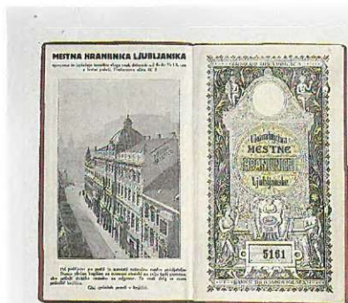
Zlata hranilna knjižica Mestne hranilnice ljubljanske iz tridesetih let

Po prvi svetovni vojni je želja po lepi zunanji podobi knjižic razumljivo nekoliko upadla, saj so se hranilnice zaradi visokih vojnih posojil, ki so jih morale podpisati, znašle v težkem položaju. Vendar pa najdemo že