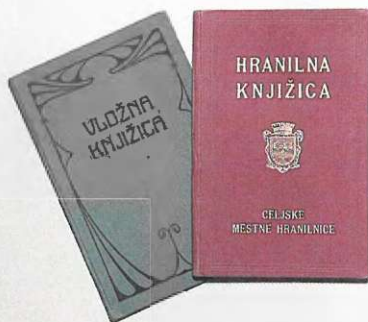
Hranilna knjižica Celjske mestne hranilnice iz šestdesetih let