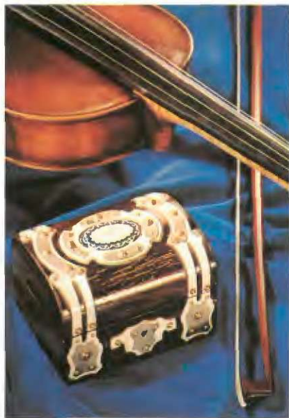
Dunajska lesena skrinjica iz 19. stoletja

Že pred prvo svetovno vojno so nekatere močnejše hranilnice namenile varčevalcem hranilnike; glede tega je znana Ljubljanska mestna hranilnica. Kasneje so njenemu zgledu sledile številne hranilnice. Sprva so bile oblike hranilnikov enake, štirioglate, z ročajem na vrhu in z odprtino za