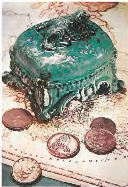
Angleški hranilnik iz 18. stoletja