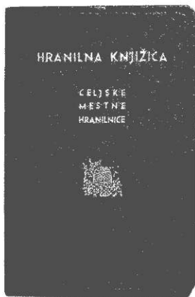
Knjižica Celjske mestne hranilnice iz tridesetih let

je videl dober vzor za svoje načrte v čeških denarnih zavodih, ki so takrat že uspešno delovali tudi v narodov blagor.