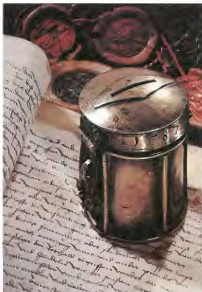
Bavarski hranilnik iz 16. stoletja

danes v Južni Franciji, delih Španije in Italije. To lahko trdimo tako glede oblik in izdelave, pa tudi uporabe gline.