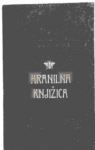
V Celju je delovala takrat edina delavsko-stanovanjska zadruga; imenovala se je Lastni dom. Knjižica je iz okoli 1905