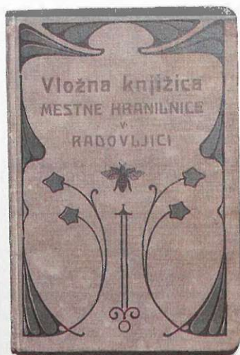
Knjižica Hranilnice Radovljica iz okoli 1910

Tuji gospodarski moči so se Slovenci morali postaviti v bran in znan je poziv dr. Josipa Vošnjaka v Slovenskem narodu, ko poudarja nujno potrebo po gospodarski osamosvojitvi našega naroda. Narodni veljaki njegovemu pozivu niso kaj prida sledili, saj so še vedno prevladovala prepričanja, da se narod najbolje narodno utrjuje v čitalnicah. Vošnjak