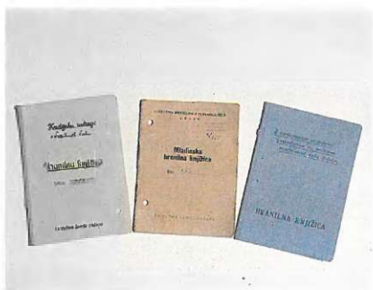
Knjižice za mladinsko varčevanje iz Celja (po osvoboditvi)