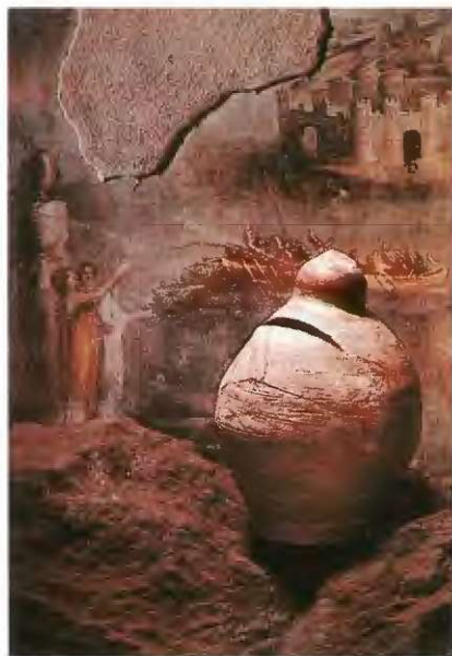
Grški hranilnik thesaurus iz 3. stoletja pred n. š.

Če pričnemo naš sprehod v antičnem obdobju, potem opišimo najprej grški hranilnik Thesaurus, za katerega domnevajo, da je služil helenističnim duhovnikom za zbiranje darov vernikov. Velja za najstarejšega med doslej najdenimi, ima obliko templja tistega časa in je glinaste izvedbe. Izraz thesaurus je koren za pozneje uveljavljeno besedo trezor, ki je še danes v rabi med bančniki vsega sveta. Domnevajo tudi, da so že stari