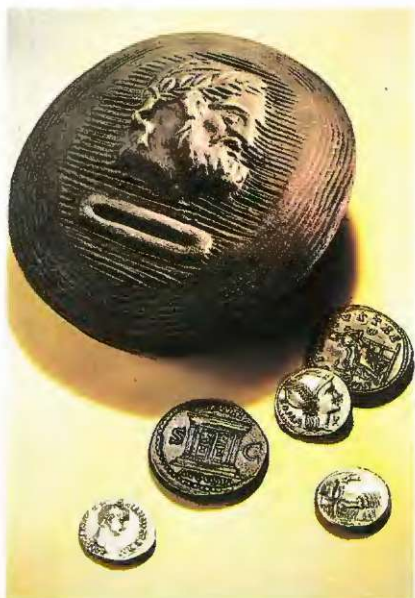
Rimski hranilnik iz 1. stoletja pred n. š.

Grki uporabljali hranilnike raznih hruškastih oblik, vendar pa za tako trditev manjka dokazov.