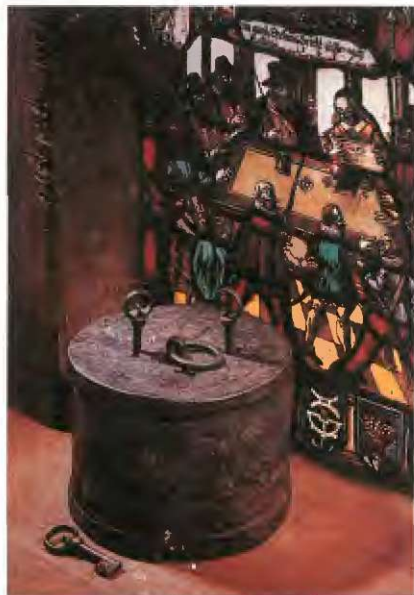
Cehovski hranilnik iz 17. stoletja