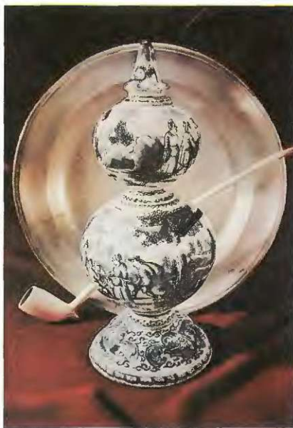
Veliki holandski hranilnik iz okoli 1700