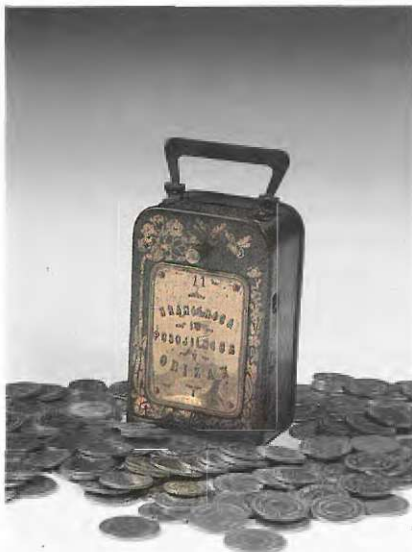
Lep primerek domačega hranilnika iz okoli 1910 (Hranilnica Griže)

kovance prav tako na vrhu. Običajno so to bili svetli kovinski izdelki ključavničarskih mojstrov. Res pa je, da so bili trajni, saj jih ni bilo mogoče zlahka poškodovati. Dosledno so nosili napis hranilnice, katere last so bili. Hranilnice so jih namreč samo posojale varčevalcem.