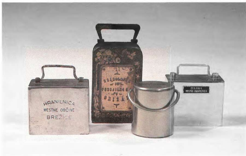
Domači kovinski hranilniki iz dvajsetih let in hranilnik iz l. 1910

1946 vse ukinjene. V veliki meri so varčevanje pospeševale komunalne in kreditne banke, pa tudi zadružne hranilnice in posojilnice. Prav slednje so pričele poglobljeno sodelovati s šolami v mladinskem varčevanju. Tako je razumljivo, da so se hranilniki v novi Jugoslaviji pojavili sorazmerno pozno in ne že takoj po osvoboditvi. Oblikovno so bili enotni, industrijske izdelave in največkrat kovinski. Šele z uveljavljanjem plastičnih izdelkov so se pojavili hranilniki najrazličnejših oblik. Izdelovalci so videli v tem predvsem samo poslovne možnosti, zato niso zunanji podobi izdelkov posvečali ustrezne skrbi. Tako so postali hranilniki predmet hlastanja po denarju, manj pa odraz časa in okolja, v katerem so nastajali. V bankah je bilo premalo smisla za lepoto in ustrezno zunanjo podobo. Kot izjemo lahko navedemo Zadružno hranilnico in posojilnico v Celju, Kreditno banko Celje ter kreditni banki v Mariboru in Ljubljani. Slednja je že imela kmalu svojo službo za poslovanje s prebivalstvom in je skrbela za enotno zunanjo podobo bančnega delovanja. Vendar pa so naše banke nasploh posvečale premalo skrbi enotni zunanji podobi vseh bančnih pripomočkov.