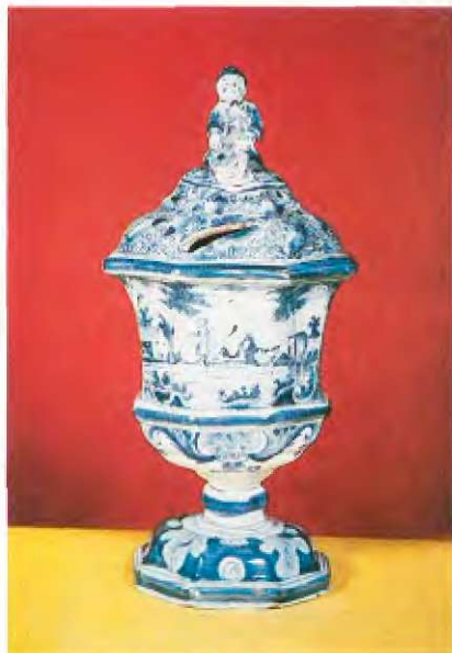
Hranilnik v obliki pokala iz okoli 1730

stveno proučujejo. Lahko trdimo, da sodi k ugledu denarnega zavoda tudi zbirka hranilnikov in numizmatični zaklad. Denarni zavodi skrbijo za pospeševanje proučevanja vedenja o preteklosti denarništva nasploh. Pri nas je ta pobuda bolj zapostavljena. Narodna banka Slovenije je izdala ugledno knjigo o partizanskih vrednostih papirjih, celjska banka pa je založila dve knjigi o preteklosti denarništva na območju Celja. Ljubljanska banka je omogočila proučevanje in zapis o delovanju Mihaela Vošnjaka, o šolskem hranilništvu in o začetkih šolskega hranilništva na Slovenskem. Morda nismo vsega našteli, vendar pa je jasno, da bodo morale glede tega banke narediti še kaj več.