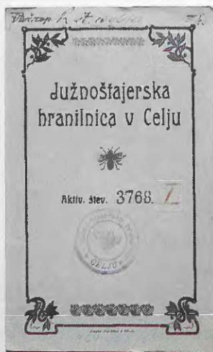
Hranilna knjižica Južnoštajerske hranilnice v Celju iz okoli 1910