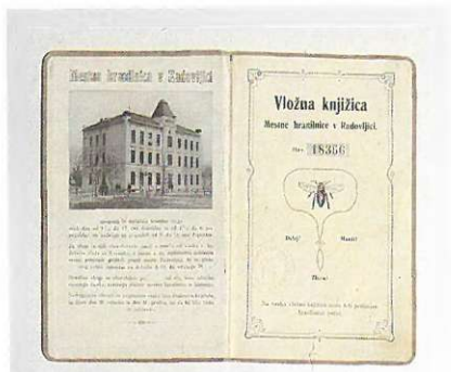
Vložna knjižica iz Radovljice