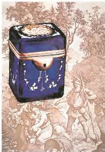
Stekleni hranilnik z medeninastim okovjem iz Šlezije okoli 1840

Kitajci so veliko uporabljali obliko prašička, Japonci spet obliko denarne skrinje, v Južni Aziji so uporabljali bambusovo cev, v Čilu so znani lepo izrezljani hranilniki, obraz indijanske kulture. Pogosto so izdelani v obliki človeka, konja in vseh vrst drugih živali, najdemo pa tudi izredne rezbarije iz kokosovega oreha. Keramični izdelki so bogato pobarvani. Alžirski hranilniki so iz gline, le redke pa so najdbe na območju Konga. Zbiranje hranilnikov je v svetu velika kulturna naloga. Predmete znan-