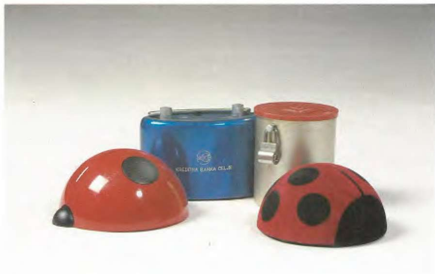
Nekaj hranilnikov Ljubljanske banke

Uporabljeni viri: Stuttgarter Zeitung, številka 28/1968 Tyll Kroha, Sparbuechsen ein Brevier, Branschweig 1959 Lebenskunst in kleiner Muenze, Deutscher Sparkassenverlag, Stuttgart 1960 A. Videčnik, Hranilništvo skozi čas, Celje 1971