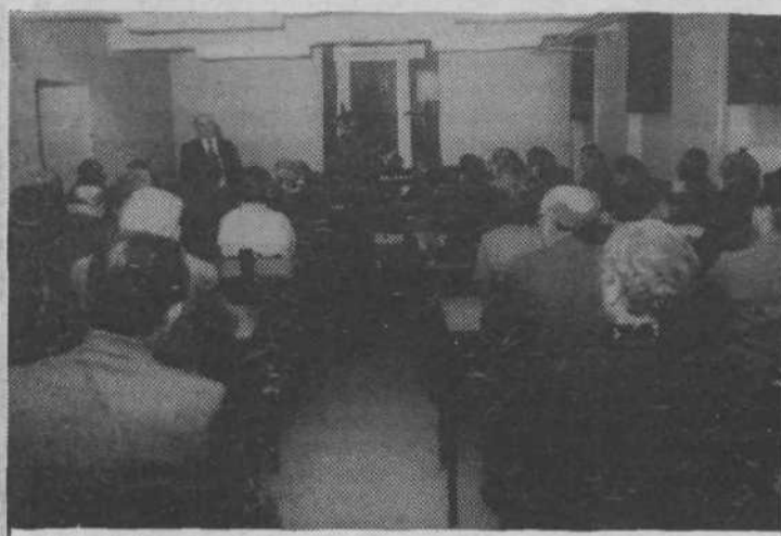
Dne 24. aprila je bila ob prazniku Krajevne skupnosti Kodeljevo in občine Ljubljana Moste-Polje slavnostna seja skupščine KS.