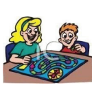
igrati društvene igre