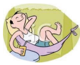
ne raditi ništa