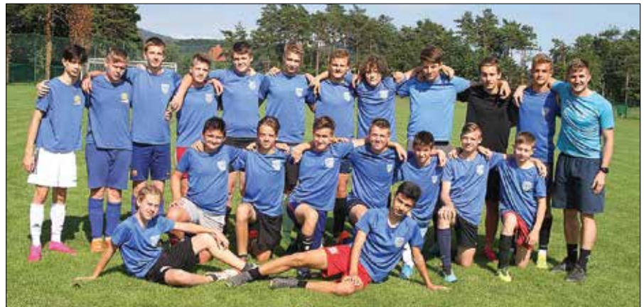
Julija bodo člani ND Mozirje počitnikovali, avgusta pa se polni energije vrnili v Športni park Mozirje.