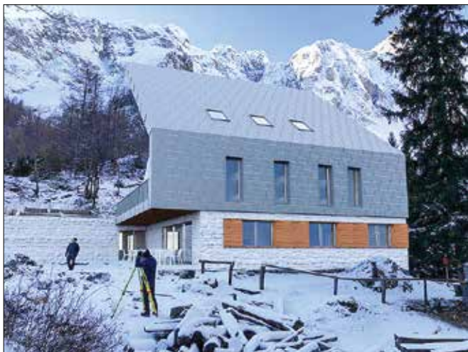
Nov Frischaufov dom na Okrešlju bo sodobnejši, grajen po modernih kriterijih in temu primerno opremljen ter prostornejši.

V začetku lanskega novembra je priljubljena planinska postojanka na Okrešlju pogorela do tal. Po zaključeni kriminalistični preiskavi je bila kot vzrok navedena napaka na električni napeljavi. Dom je torej pogorel zaradi več kot 60 let stare električne napeljave. V veliki me-