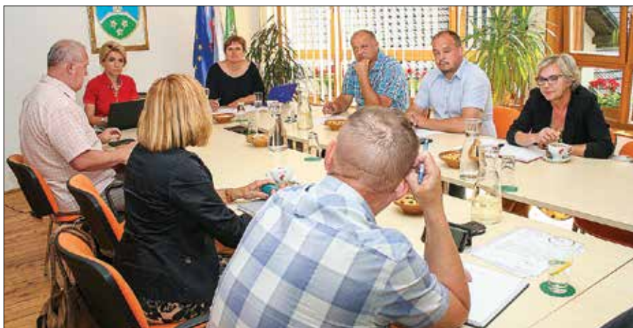
Županji in župani so izrazili nezadovoljstvo, ker se ruši odlična organizacija pomoči, brez katere marsikateri starejši, bolan ali invalidni občan ne bi mogel ostati doma.