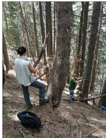
Meritve lesne zaloge na stalnih vzorčnih ploskvah

stnike gozdov in tudi vso ostalo zainteresirano javnost povabili na javno razgrnitev in obravnavo načrta.