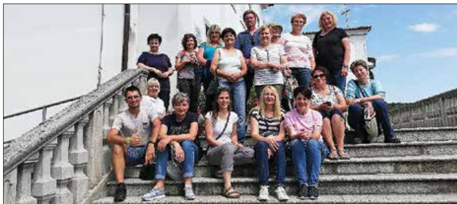
Članice in člani zeliščarskega krožka pred samostanom na Kostanjevici