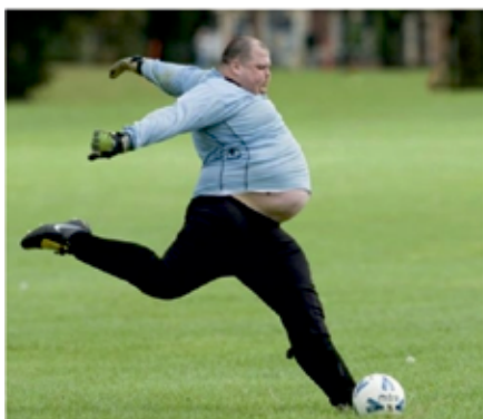
Fantje, lepo je biti po dolgem času spet na igrišču!

Ločan: "Presneti turistični boni. Zdaj bi zaradi njih šli na dopust še tisti, ki niso bili nikdar." Ljubijčanka: "Pa zakaj te to tako jezi?" Ločan: "Ded, ki je star skoraj 90 let, jih po vsej sili hoče izkoristiti v planinski koči." Ljubijčanka: "Pa naj jih, kaj?" Ločan: "V koči na Kredarici!"