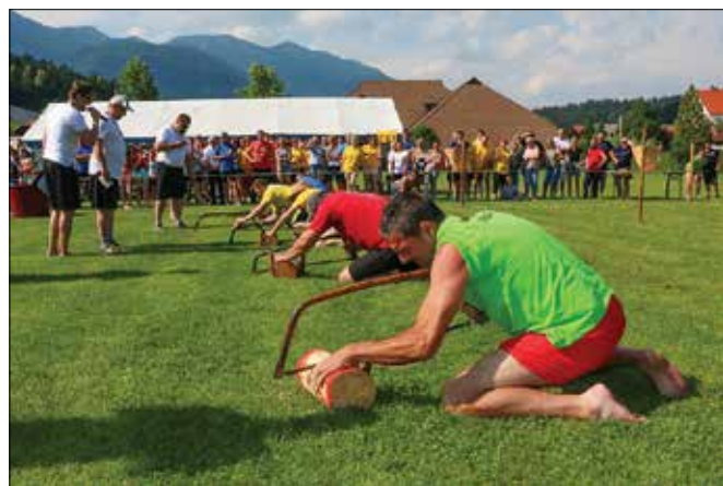
Žaganje hloda z ročno žago je terjalo veliko natančnosti.