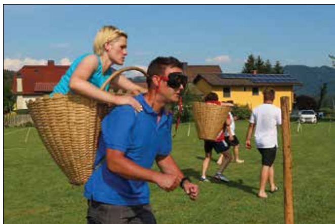
Nosač s prevezo na očeh je potreboval natančna navodila osebe v košu.