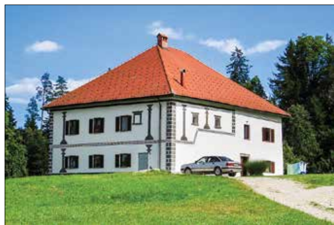
Dvorec Lešje je najstarejša ohranjena posvetna stavba v občini Rečica ob Savinji.

stoletja, ki jo je po zgodovinskih virih zapisal Varpoljčan Jože Tlaker , je grad verjetno začel propadati po omenjenem opustošenju. Tlaker namreč omenja, da niti iz nadškofijskega niti iz graškega arhiva ne izhaja kakšen dokument, ki bi nakazoval na obnovo poslopja po požigu leta 1635.