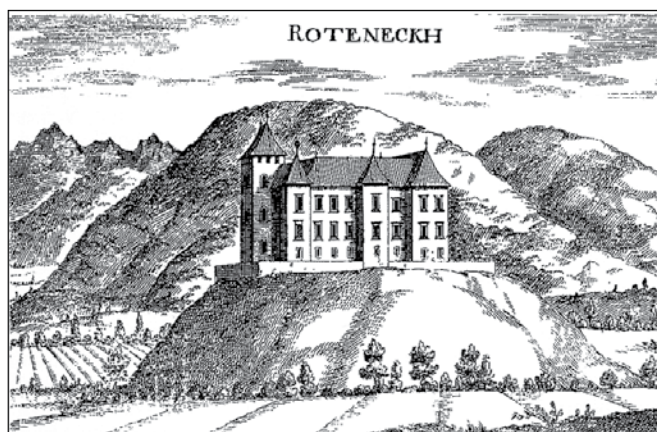
Grad Rudenek na upodobitvi Georga Matthäusa Vischerja iz okoli leta 1681