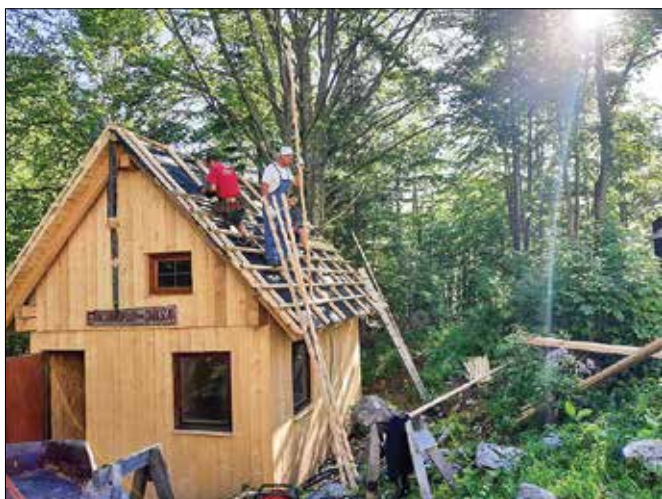
Na Okrešlju so postavili začasno barako, ki jo uporabljajo delavci.

Akcija za gradnjo nove postojanke je stekla že v parih dneh po dogodku. Ko je vreme dopuščalo, v času požara je bilo namreč zelo sla-