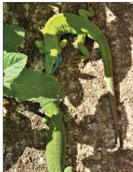
Ej, vi, tam zgoraj, tudi midva se imava rada.