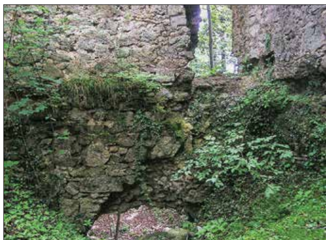
Le še ruševine dokazujejo obstoj nekoč mogočnega gradu Rudenek.

Znano je tudi, da je na dan 18. oktobra 1628 škof Tomaž Hren v