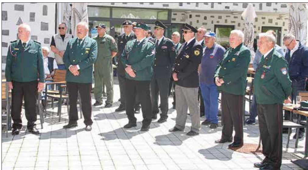
Na terasi hotela Golte so se zbrali številni udeleženci slavnostnega dogodka.