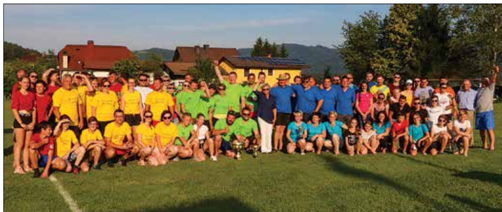
Udeleženci šaljivih iger so poskrbeli za druženje, smeh in tekmovalnost.