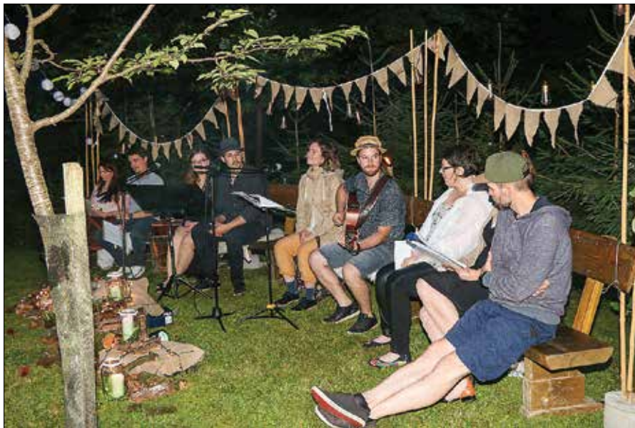
Člani Kulturnega društva Rečica ob Savinji so pred lovskim domom v Poljanah pripravili program recitacij in pesmi, ki so govorile o ljubezni, erotiki in zvestobi.