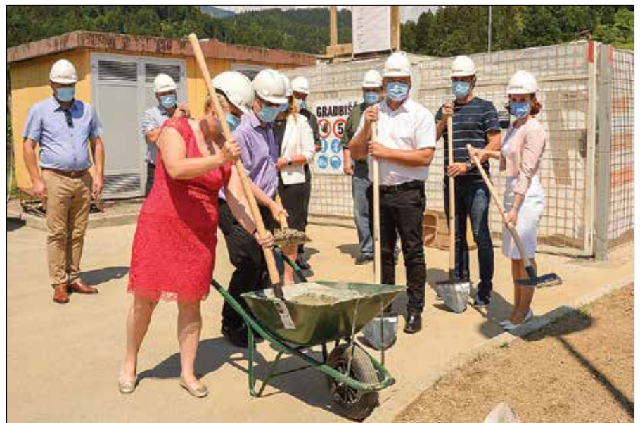
Ob gornjegrajskem centru starejših so postavili temeljni kamen za izgradnjo modernega centra za delo z osebami z demenco.