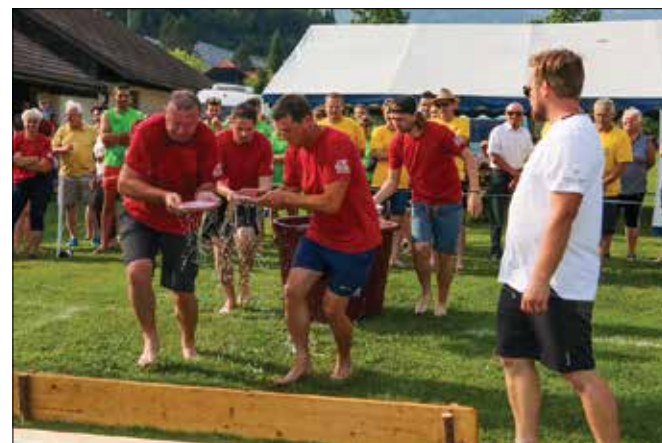
Pri prenašanju vode v krožnikih je bilo potrebno paziti tudi na oviro.