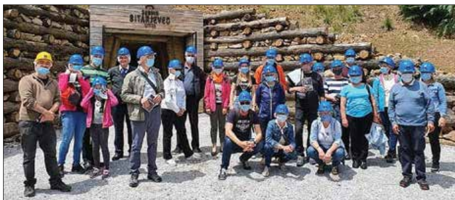
Izletniki so si ogledali rove in razstavne eksponate rudnika Sitarjevec v Litiji.

Naslednja postaja popotne družine je bil rudnik Sitarjevec v Litiji. V spremstvu vodnika so