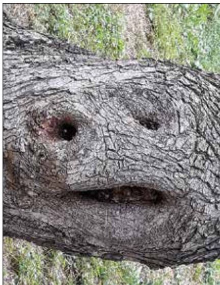
Nasmeh debla drevesa je malo bolj kisel, a je.