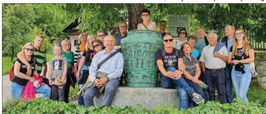
V Vačah pri eni najpomembnejših zgodovinskih najdb v Sloveniji - vaški situli