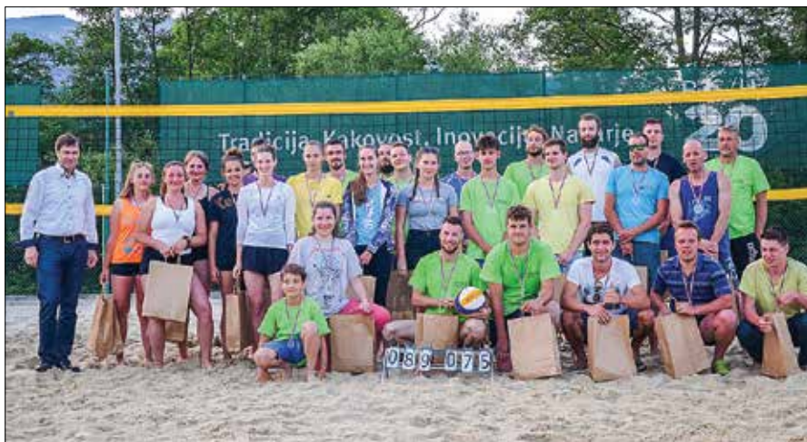
V Varpoljah je ponovno zmagalo prijetno druženje in dobra volja vseh nastopajočih.

Predvsem se je to poznalo ekipi A, ki je dve uri pred koncem še vodila za 60 točk, v končnici pa prepustila vodstvo in zmago ekipi B. Rezultat 2089:2075 je bil na koncu le nepomemben visok točkovni izkupiček, pomembno je bilo predvsem to, da je ponovno zmagalo prijetno družje-