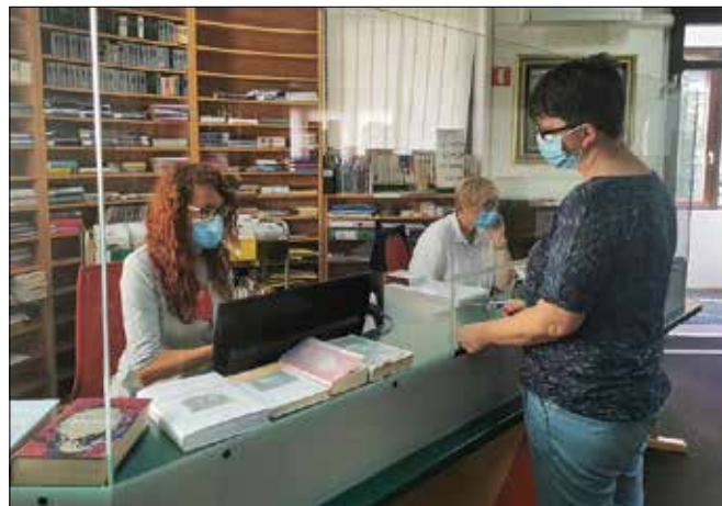
V Knjižnici Mozirje so po koncu epidemije poskrbeli za popolno zasteklitev izposojevalnega pulta in s tem poskrbeli za večjo zaščito tako zaposlenih kot strank.

Tako imajo že pripravljen seznam gradiva, ki se bo prebiral v okviru 16. bralne značke za odrasle. Pogled v prihodnost knjižnice na območju naše doline so zazrli tudi v nekaterih občinah, kjer so prepoznali potrebo po posodobitvi, ši-