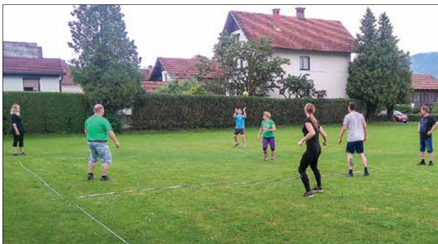
Igra med dvema ognjema je tudi med odraslimi zelo priljubljena.