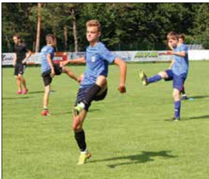
Ob razglasitvi konca epidemije so se nogometaši vrnili na zelenice ob Savinji, najmlajši pa na igrišče ob Osnovni šoli Mozirje.

V času epidemije so morali nogometaši trenirati sami. Navodila za treninge so dobivali s strani trenerjev preko družbenih omrežij, kamor so nato objavljali posnetke svojega dela. Kljub temu to ni bilo to, saj v društvu poleg učenja tega športa spodbu-