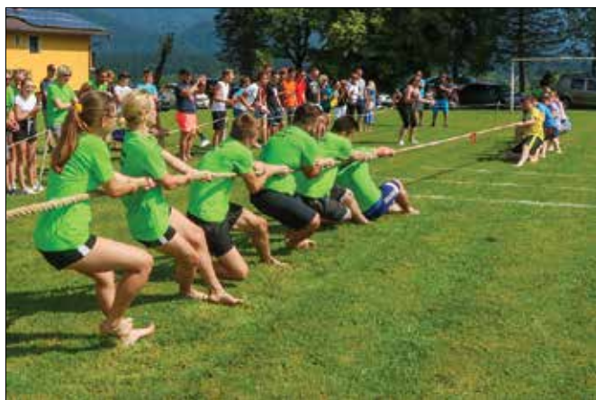
Zmagovalci letošnjih šaljivih iger so postali člani ekipe Spodnja Rečica.