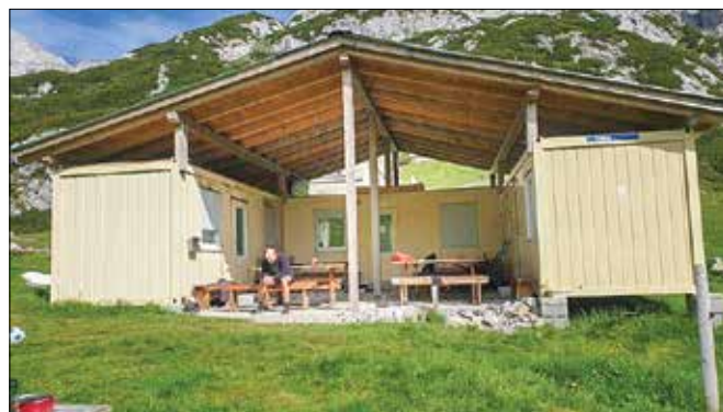
Pri PD Celje Matica so na Korošici ob pogorišču Kocbekovega doma postavili tri kontejnerje. V enem od njih bodo na voljo tudi zasilna ležišča.

bo, so na pogorišče začeli prihajati planinci in drugi prostovoljci, ki so hoteli pomagati. Čiščenju okolice je sledila postavitve začasne lesene barake, ki jo sedaj uporabljajo delavci, v njej pa je mogoče dobiti tudi kakšno tekoče okrepčilo. Ob baraki je iz palet zrasla Okrešljaska plaža, ki ob sončnih dnevih privablja obiskovalce in nudi čudovite razglede na okoliške vršace.