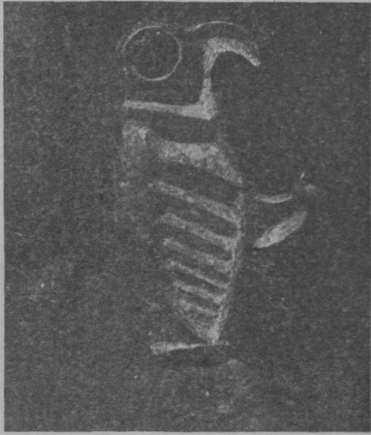
Bronasta sponka s Korinjskega hriba