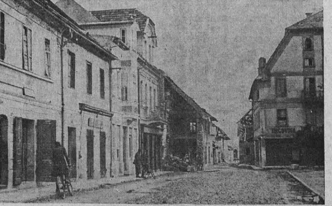
Zgornja slika, katero je vzel Theodore Andrica, reporter "Cleveland Pressa," prikazuje, kako izgleda danes glavna ulica v Ribnici.