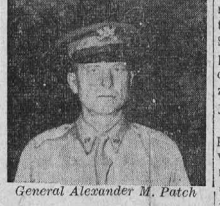
General Alexander M. Patch

Gen. Patch je bil 56 let star in zapušča vdovo, ki je bila ob njegovi strani, ko je umrl.