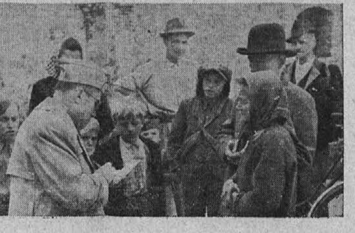
Druga slika predstavlja clevelandskega reporterja, ko dela zapiske tekoma razgovora s prebivalci, ki imajo sorodnike v Clevelandu.