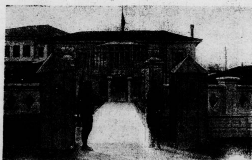
Dvorec kralja Ahmeda Zoga v Tirani