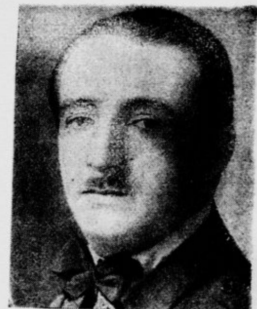
Albanski kralj Ahmed Zogu