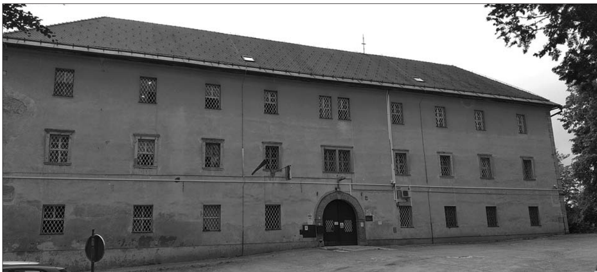
Zavod za prestajanje kazni zapora Ig danes.