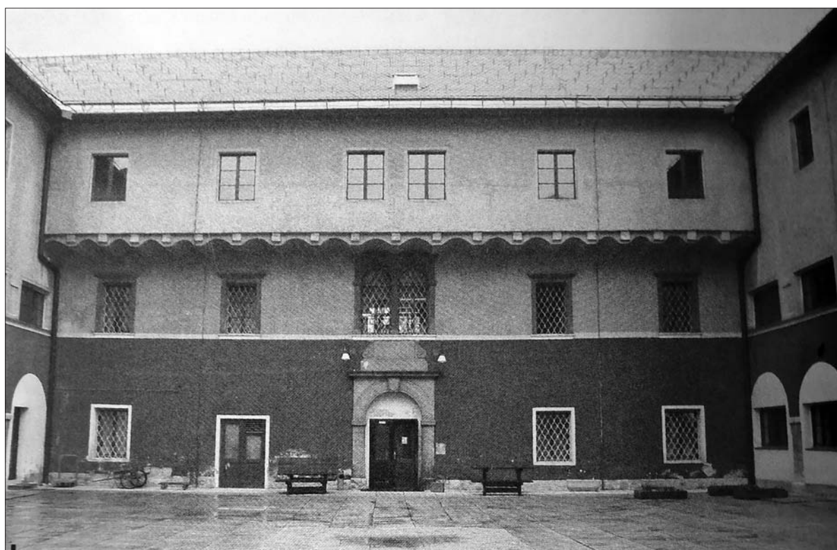
Notranje dvorišče ižanskega gradu (Mostiščar, glasilo občine Ig 8, 2002, št. 3, str. 6).

prisoners, including several priests. In their memoirs, some provided detailed descriptions of their life in prison and work in various workshops.