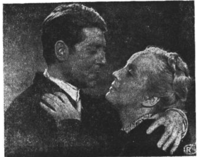
Iz filma: »Velika iluzija«. Film ima na sporedu kino »Sloga« od 23. do 25. t. m.