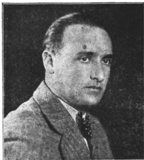
G. Jože Gostič poje 20. t. m. v radiu operne speve.