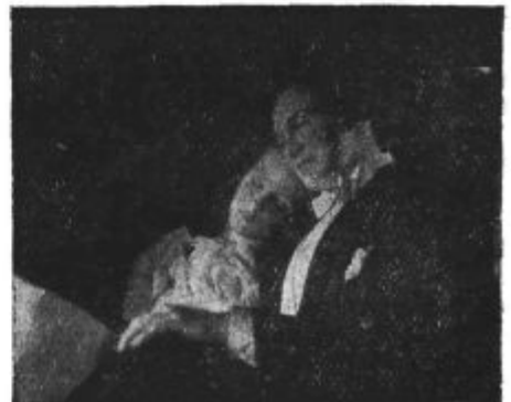
Iz filma: »Gospodična Mozart«. Film je na sporedu v kino »Sloga« od 19. do 22. novembra.

Naš namen je, da napravimo revijo res sodobno, zanimivo poučno in zabavno. Vse to pa le v mejah, do katerih moremo. Glavno skrb bomo posvetili temu, da bo revija najboljši posredovalec med našim radijem in njegovim sporedom ter med naročniki in poslušalci. Če bomo dosegli to, bomo obenem s tem dosegli tudi svoj namen.