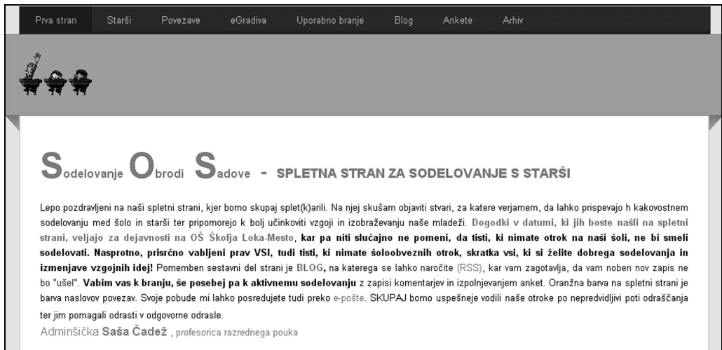
SLIKA 2 Prva stran spletne strani sos

Spletna stran je sestavljena iz devetih strani – zavihkov, kjer sistematično zbiram vse, za kar menim, da bi v praksi koristilo staršem pri njihovem delu z otroki in pri sodelovanju z učitelji.