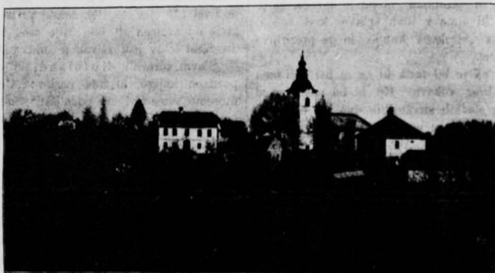
Ajdovec pri Žužemberku.

Udje družbe plačujejo po 1 krono 20 vinarjev ali 60 krajcarjev na leto, ustanovniki po 10 kron ali za vselej 100 kron, dobrotoiki pa kolikor kočejo. — Želi se, da se plača, če mogoče, udnina za več let skupaj, n. pr. za 5 ali 10 let, ker se na tak način denar prej naloži na obresti. Za ude, ustanovnike in dobrotnike cerkvene družbe se obhajajo večne maše in sicer vsak prvi petek v mesecu, razun štirih mesecev, v katerih se nahajajo kvatni tedni. V teh štirih mesecih so pa mrtvaška opravila enaka, kakor vernih duš dan in pa peta črna maša za večni