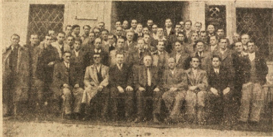
Delavski svet rudnika Trbovelje-Hrastnik

Ob vsem tem, kar smo v prednjih vrsticah povedali, pa mora opraviti veliko vzgojno nalogo med rudarji poleg delavskega sveta tudi sindikalna organizacija rudarjev.