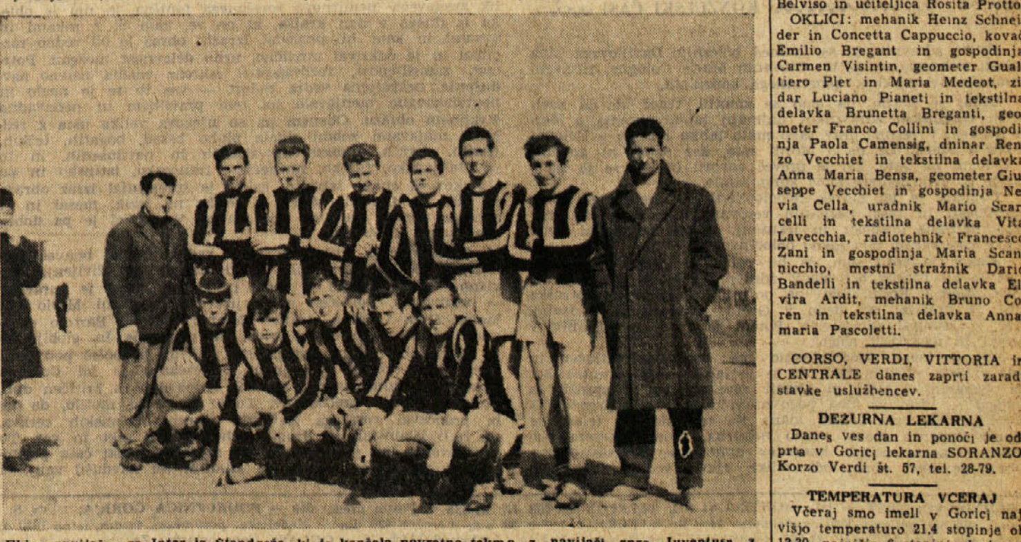
Ekipa navijačev za Inter iz Štandreža, ki je končala povratno tekmo z navijači sproti Juventus z neodločnim rezultatom 2:2, čeprav jim je v prvem polčasu precej trda predla