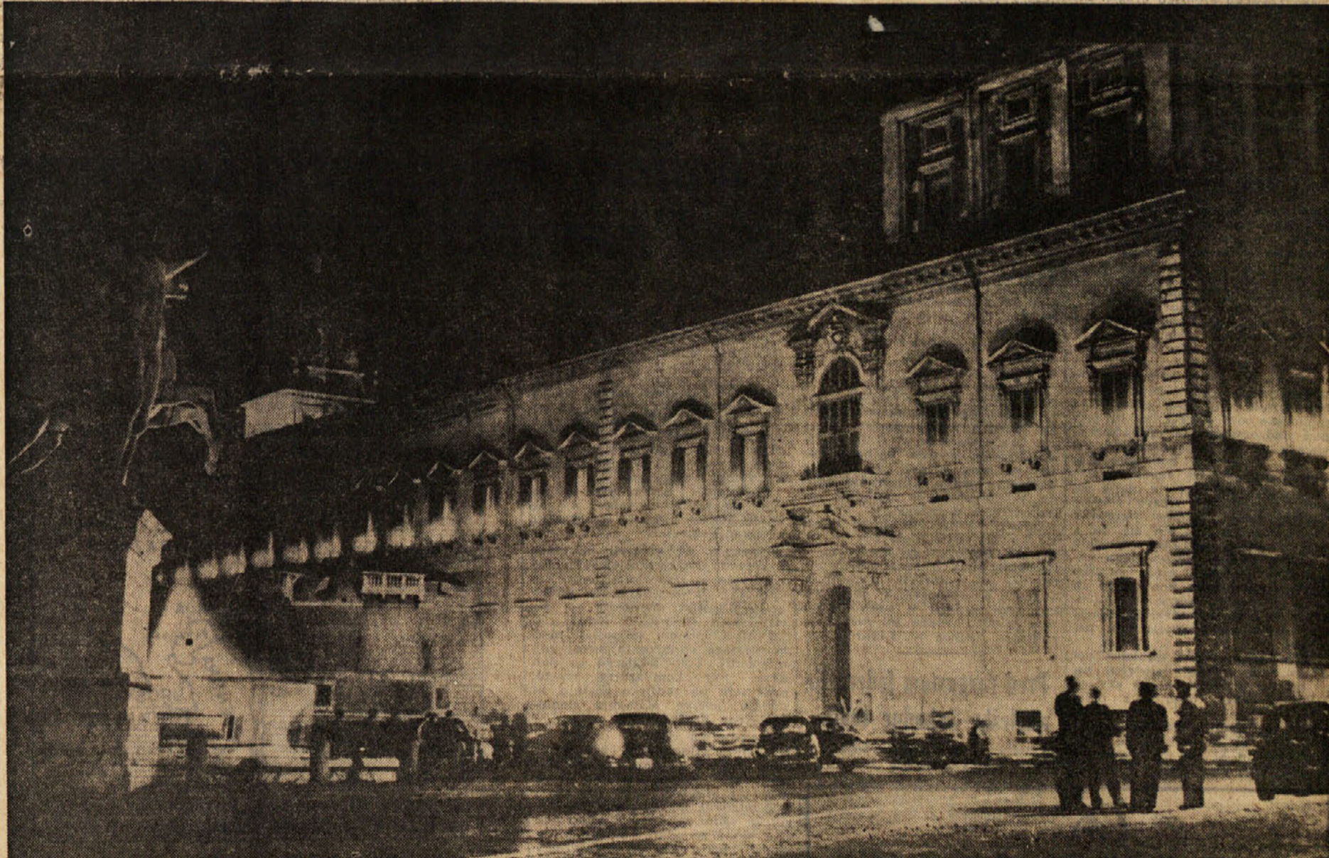
Zgoraj: Segni in Saragat. Spodaj: Kvirinal, kjer je sedež predsednika republike