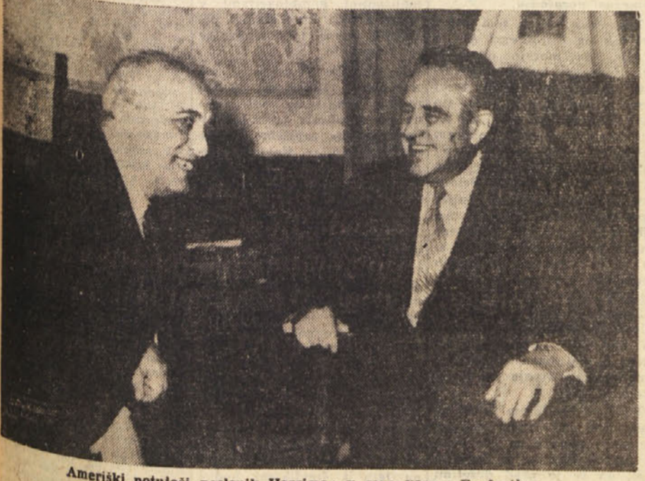
Ameriški potujoči poslanik Harriman v razgovoru s Fanfanijem

Harriman obišče danes predsednika republike Gronchija, jutri pa odpotuje z letalom na dvodnevni obisk v Teheran - Pokrajinski odbor KD v Milanu ugotavlja neuspeh pogajanj in predlaga enobarvno pokrajinsko upravo KD - Spopadi med delavci in policijo v Neaplju