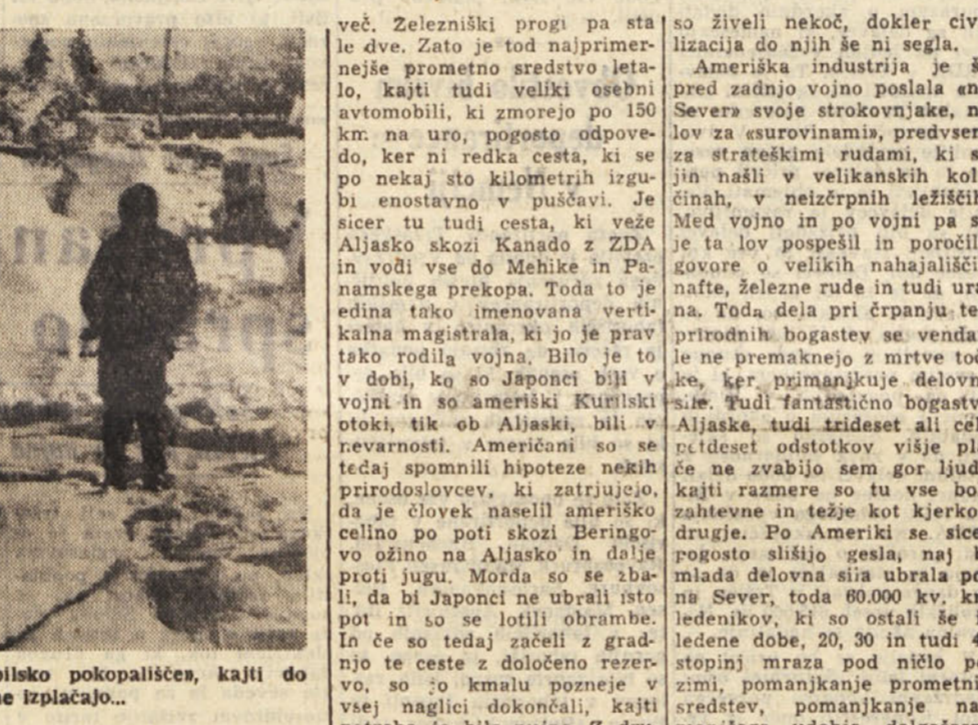
Ko na Aljaski avtomobil odpove, ga zapeljejo na avtomobilsko pokopališče, kajti do plavžev v Pittsburgu je daleč in se stroški ne izplačajo...

Velikansko prostranstvo, cel kontinent, s skromnim številom prebivalstva, katerega polovico tvorijo vojaki - Kako je civilizacija morila domače ljudstvo