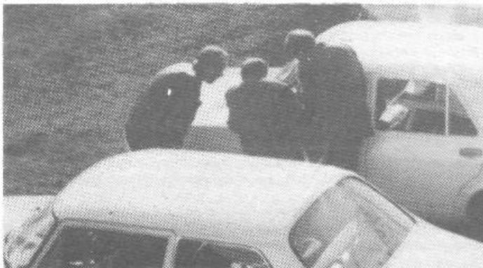
Kar trije »vlomilci« so se lotili odpiranja stoenke! Uspelo jim je! Le čez nekaj minut jo je eden izmed njih odpeljal! Kako in kaj se je razpletlo kasneje, je skrivnost!