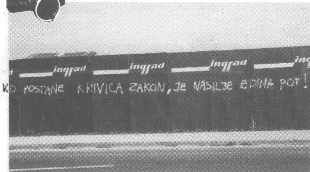
Napis na ograji, za katero se skriva bodoči Center varnosti Šiška zanesljivo pove vse: »KO POSTANE KRIVICA ZAKON, JE NASILJE EDINA POT!«