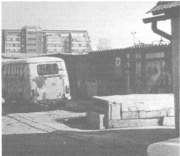
Ob železnici je za naš fotoutrip veliko hvaležnih motivov. Tokrat smo posneli še eno »montažno« gradnjo z »dostavnim avtomobilom«.