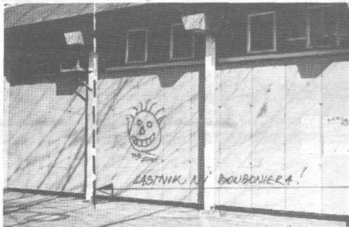
V prejšnji številki smo objavili fotografijo nasmejanega obraza, ki ga lahko zagleda občan, ko »vesel« stopi iz občinske zgradbe. Napačno pa smo zapisali, da je na zidu BONBONIERE. Delavcem Bonboniere se opravičujemo in hkrati kot popravek objavljamo fotografijo, kjer piše da lastnik zidu ni omenjena organizacija. Od kogarkoli že je, mu ni v okras.