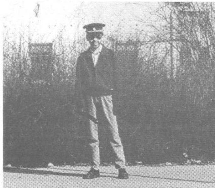
Budno oko »miličnika«, je pozorno spremljalo promet na Celovski. Minus 10% je resna zadeva in ne samo pustna norčija