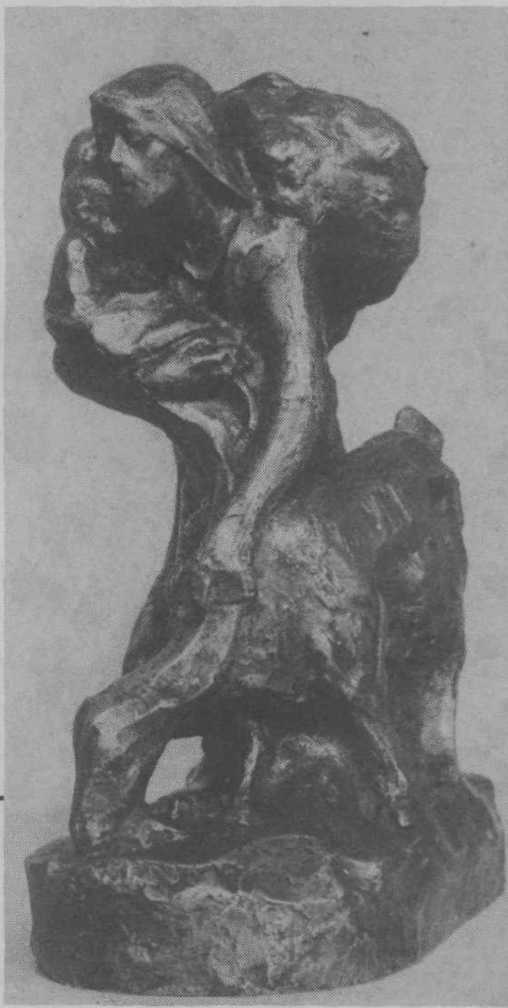
ŽENA S KOZO

»Brezumnica,« reče druga, »vidiš, jaz pa sem nosila le manjše koščke: le pojdi gledat, kakšen kup jih je! Seveda, ti hočeš vse naenkrat. Nu, pa imaš. Boš vsaj vedela za drugokrat!«