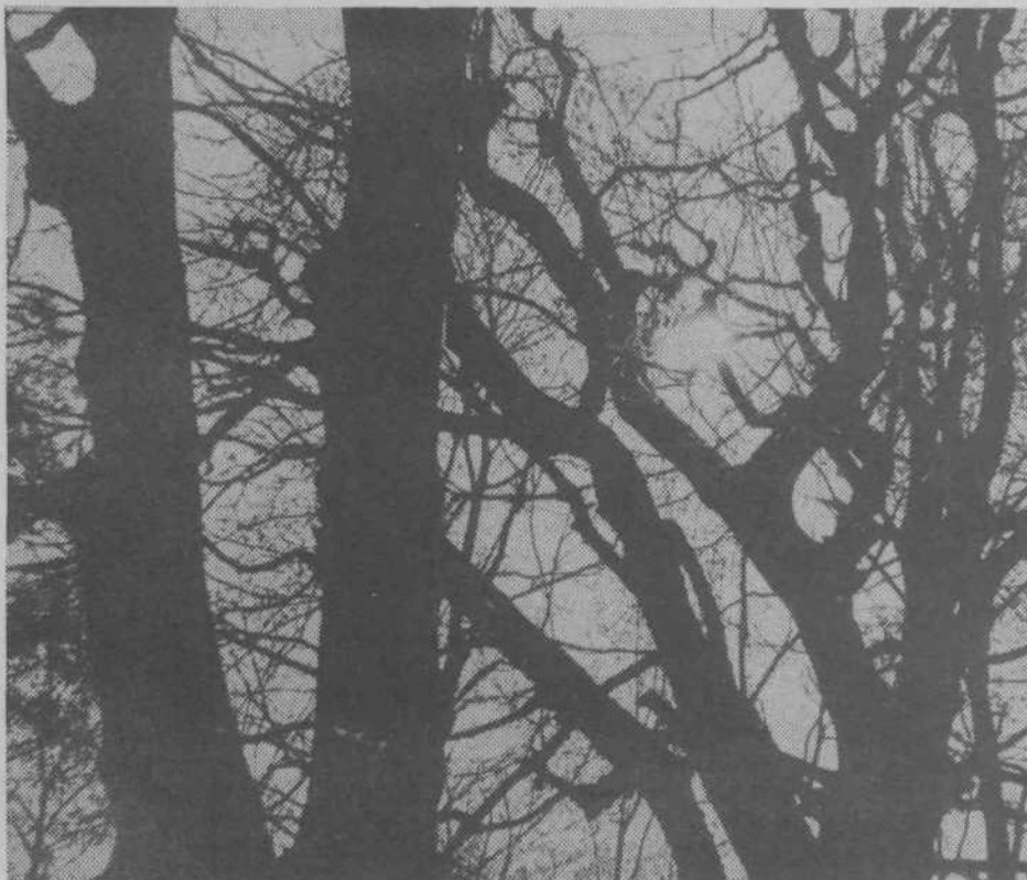
Jesensko sonce v krošnjah