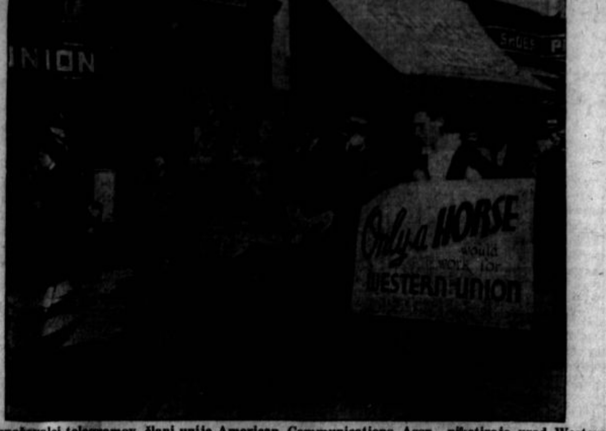
Raznaševalci telegramov, člani unije American Communications Assn., piketirajo urad Western Union Co. v San Franciscu, Cal.

četek znam zmerom, potem pa se mi zatakne in ne znam dalje. — Poskusil sem iti v drugo smer. Tam sem našel na zakonski par, ki je zastavil pot. Ona je bila velika in suha, on majhen in debel. Spominjala sta me na širafa, ki se je z mrožem zapletla v prepri. — To je spet tebi podobno, — je zagodrnjala širafa. — Da me pripelješ v labirint! Krive poti, nepregledna zmeđa — kakor našlaš zate! Kakšen obupen okus imaš! Mrož jo je nezapudno premeril od glave do nog: "Slab okus imam res," je zagodel.