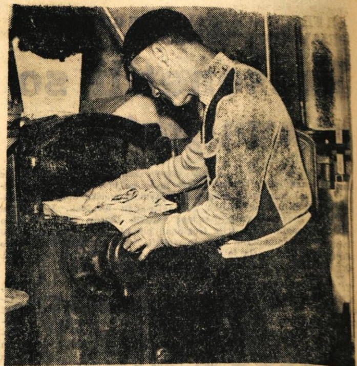
Ceprav kemična čistilnica, ki jo ima servis stanovanjske skupnosti Strazišče v Kranju obstaja šele kratak čas, je tamkajšnjim prebivcem nadvse dobrodošla. Bojazni, da bi ne bilo dela, ni več v zadnjem času se že kažejo potrebe, da samo en delavec ne bo več kos potrebam

S tem seveda ni rečeno, da ni možnosti za zaposlovanje žena v jeseniški občini. Kot pravijo na zavodu za zaposlovanje delavcev na Jesenicah, bo treba poiskati rezerve, ki jih je po njihovem mnenju še dovolj. Pravijo, da bo treba osvojiti nove dejavnosti, posebej pa bo treba v podjetjih, kot so lesnagalantijski obrat, razne obrti itd., poiskati še prosta delovna mesta za žene. Perspektive torej so, le z dobro voljo in pravilno politiko jih je treba izkoristiti. — M. Živkovič