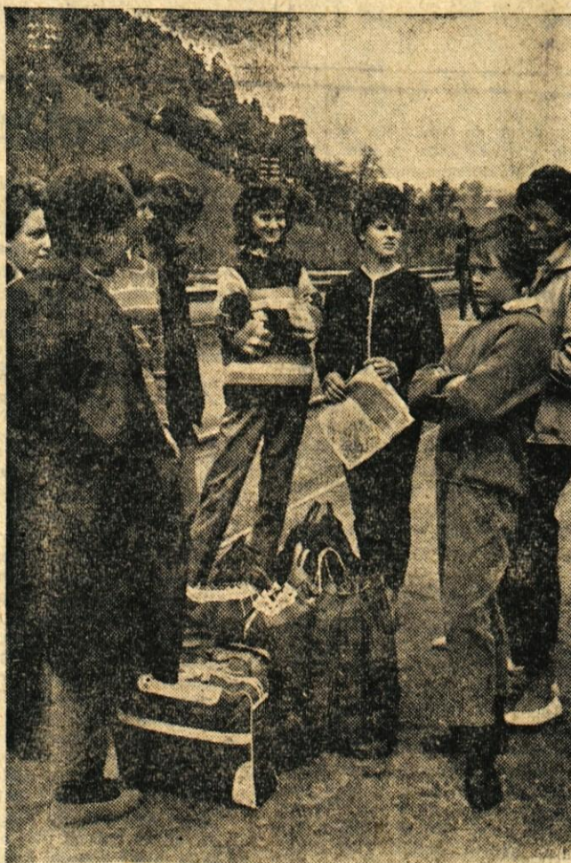
Cepprav je ekipa rokometnih igralcev prišla skupaj na kranjsko železniško postajo, so se tekmovalke hitro vključile v družbo z ostalimi mladinkami in mladinci

Danes imajo prav gotovo nekateri že prva športna srečanja. Rekorodov — vsaj od Kranjčanov — tokrat ni pričakovati. Med rokometiški, odbojkarji, šahisti, atleti in namiznotenškimi igralci so v večini mladi in bolj ali manj nepoznani obrazi. Vse vrste so sestavljene v večini iz pionirjev ali mladih neizkušenih igralcev in