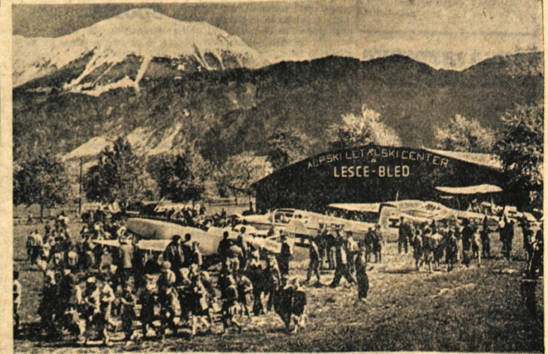
V ponedeljek, ob 20-letnici JUGOSLOVANSKEGA VOJNEGA LETALSTVA se je na letališču v Lescah zbralo okoli 3000 mladine, predvsem šolskih otrok iz Gorič, Tržiča, Kranja, Radovljice zakaj ALC Lesce-Bled je priredil letalski miting v malem. Ob tej priliki so otroci — zlasti mladi modelarji — z zanimanjem ogledovali letala, delovanje letel pa so jim tolmačili letavci, jadralci. Razen tega so izžrebali 20 najboljših učencev, ki so poleteli za nekaj minut nad letališčem. (Več o tem berite v sobotni »Panoramici«.) — St. S.

Tokrat v sliki • Tokrat v sliki • Tokrat v sliki • Tokrat v sliki • Tokrat v sliki • To