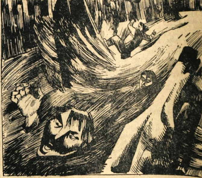
40. Box Canyon je pobiral od iskalecev zlaša mrtvaški davek. Pristali so pred vhodom v sotesko in ogledovali greben, ki je štrlel iz vode. Tam je bilo že več čolnov in lastnikov, ki si niso upali dalje. S skrbjo so zrlji v divlje kipenje valov.