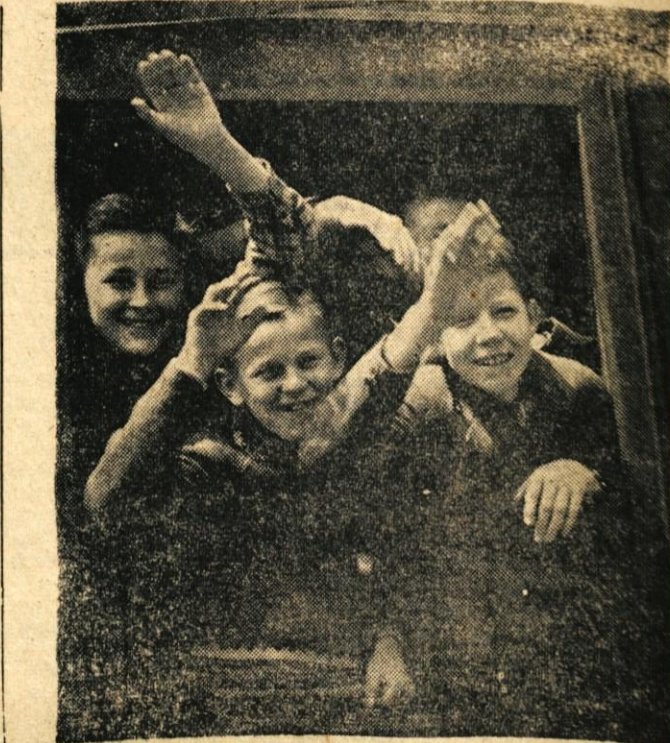
Najmlajšo ekipo kranjskih športnikov, ki je tudi potovala na festival »Bratstva in enotnosti« v Bitolo, so sestavljali obetajoči namiznotenški igralci. Ob odhodu so pristrčno pozdravljali potnike, ki so bili v tistem času na kolodvoru

Ko smo prišli tja, so bili za vse nas, razen seveda za domačine, posebna zanimivost beli fesi. In kmalu po prihodu so nekateri