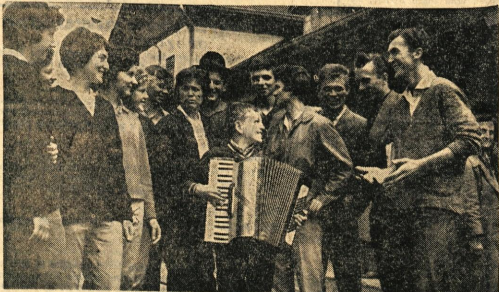
Folklorna skupina dijaškega doma na Zlatem polju v Kranju bo v Bitoli za gledavce zanimiva tudi zaradi malega harmonikaša, ki so ga na naši sliki obkrožili navdušeni mladi folkloristi

Podobno je bilo tudi prejšnja leta in pozneje, podobno pa bo tudi letos v Bitoli, čeprav se bodo srečali novi mladinci in mladinke. — B. F.