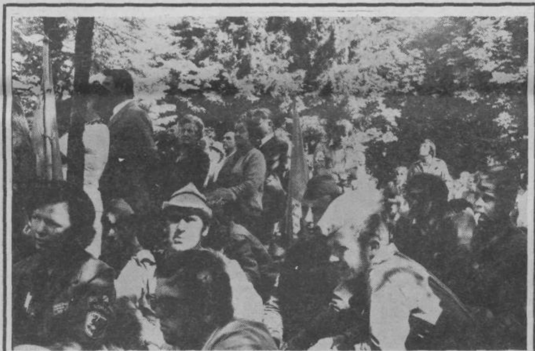
Na pohodu so se mladi seznanili s pomembnimi dogodki iz naše slavne polpretekle zgodovine. Skratka, združili so prijetno s koristnim