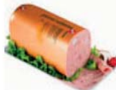
SAL.PIZZA 1kg MERC. 4,13 EUR/kg