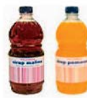
SIRUP SLAD. 1L MERC. 0,41 EUR