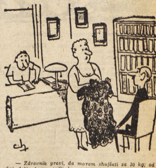
— Zdravnik pravi, da moram zhužjati za 10 kg; od sedaj dalje bomo jedli le rdečo peso... —

Založniška dejavnost v Jugoslaviji nenehno narašča in je zlasti številno del domače literature veliko. Posebno se opazja, da je bil lani velik napredek v izdajanju domačih književnih del ter knjig s področja družbene, politične in znanstvene literature. Vse jugoslavanske založbe so izdale okoli 5000 domačih del, poleg tega pa več kot 600 del tujih avtorjev.