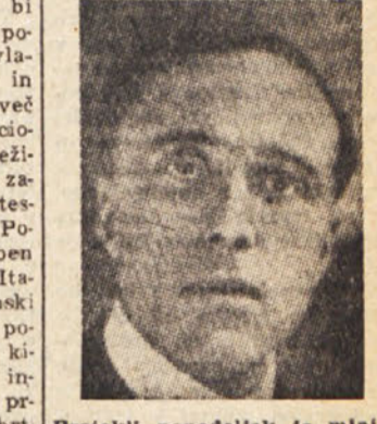
Pretekli ponedeljek je minilo 30 let, ko so fašisti ugrabili, strahotno mučili in ubili socialističnega poslanca Giacoma Matteotija, ker so mu hoteli preprečiti, da bi pred parlamentom razkril fašistični teror na splošnih volitvah

V Milanu je bilo v soboto in v nedeljo zasedanje posvečeno trgovinski zamenjavi med Italijo in Kitajsko. Na zasedanju so sodelovali vodilni predstavniki velikih italijanskih podjetij in nekateri predstavniki državne uprave. Na zaključku zasedanja so izglasovali resolucijo, v kateri zahtevajo ustanovitev bilateralnih odnosov s Kitajsko, po vzorcu Nemčije in Belgije in predvsem ukinitve embargov kot je to napravila Anglija. Poleg tega resolucija tudi zahteva okrepitev najrazličnejših stikov: veleposojev, razstav, obiskov tehnikov itd.