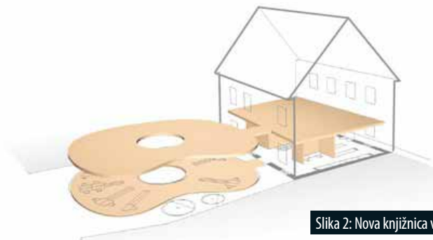
Slika 2: Nova knjižnica v središču

Workshop Architectural and urban planning Črna na Koroškem is a part of the strategy and vision for the development of the municipality. The students of the Faculty of Architecture, University of Ljubljana, developed a concept of individual interventions in Črna, Žerjavu and Farm Mežnar. Participation of municipality and faculty began by architect Matic Pajnik, who was the coordinator of the whole project. Urban design workshop started on 15 In April 2012 in Črna na Koroškem with a visit aimed at learning about the problem location, followed by a intermediate critique and finished 13th August 2012 with a public presentation made by students at tourist week in Črna na Koroškem. Students suggested a number of new intervention and programme content such as: a new library location, business incubator, a hostel with 20 - 30 beds, new traffic regulation, walking and fitness trails, ..