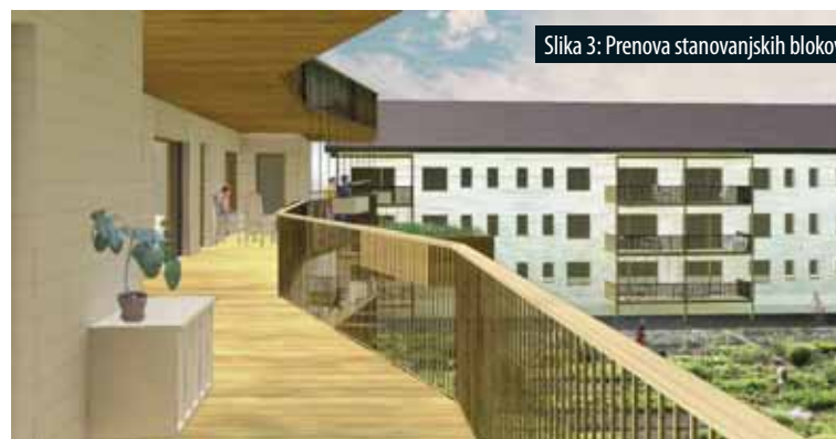
Slika 3: Prenova stanovanjskih blokov