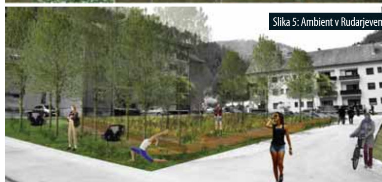
Slika 5: Ambient v Rudarjevem