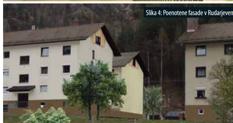
Slika 4: Poenotene fasade v Rudarjevem