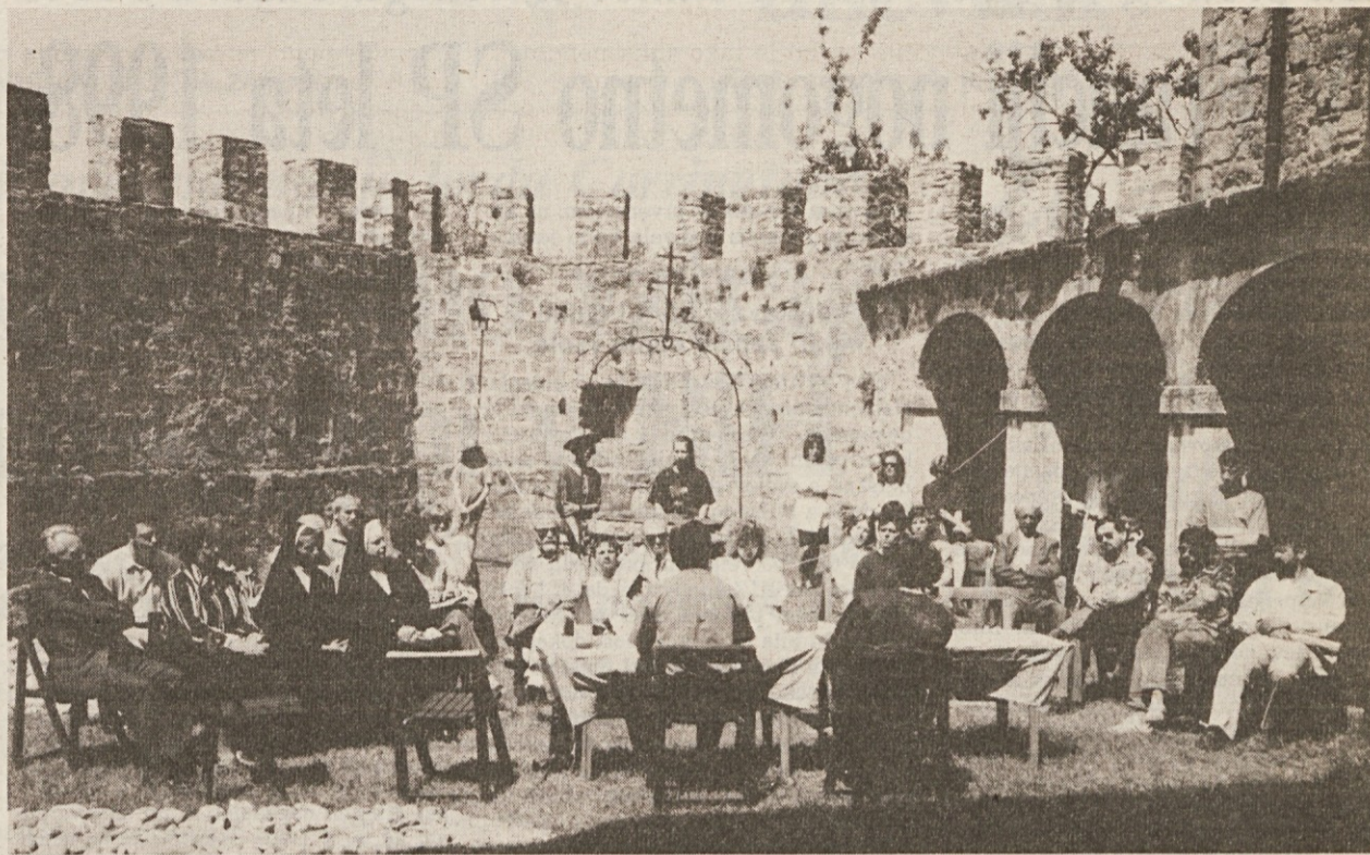
Udeleženci 6. premskega srečanja v očarljivem okviru zidovja premskega gradu