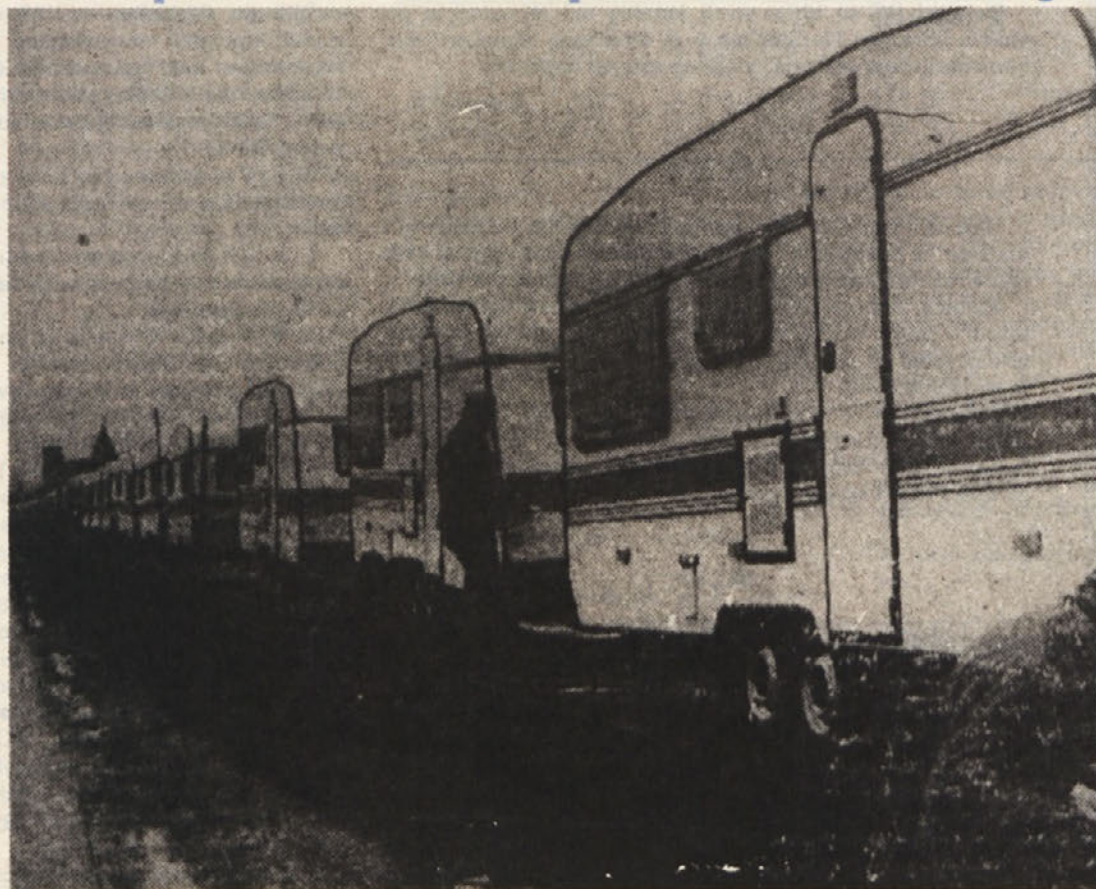
Iz brežiške tovarne prikolic je krenila na pot prva železniška kompozicija s petdesetimi prikolicami, ki so narejene po novi tehnologiji za skandinavski trg.