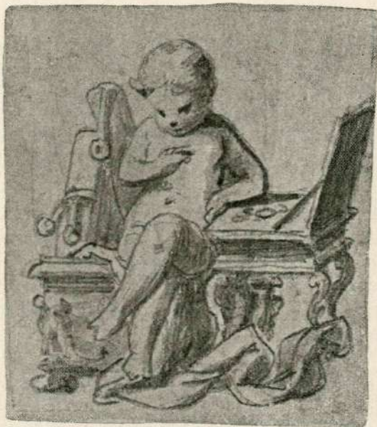
Numismatika. Iz risb Janeza Šubica.

In skoraj se zdi, da mu je le naraščala z leti neumorna pridnost in da je dobil Foersterjev talent vedno le nov vzlet, čim več je že ustvaril. Nikdar mu ni odjekla svojega blagoslova fantazija, iz katere crpa kakor iz neusahljivega vira svoje melodije, svoje po lepem in plemenitem stremeče harmonije. Sam harmoničen v svojem čutenju, v svojem mišljenju, ki ga dičita kot človeka, ki se je omilil vsakomu, kdor je ž njim občeval, je ustvarjal vedno harmonije s katerimi je hotel le osrečevati in povzdigovali srca svojih poslušavcev. Osrečeval in povzdigoval bo pa srca še poznih rodov, morda uspešneje še potomce, ki bodo znali vredno oceniti pomen moža, ki ga bo prištevala glasbena zgodovina vsikdar med svoje najboljše može, med one, na katerih sloni sedanji in bodoči razvoj slovenske glasbe.