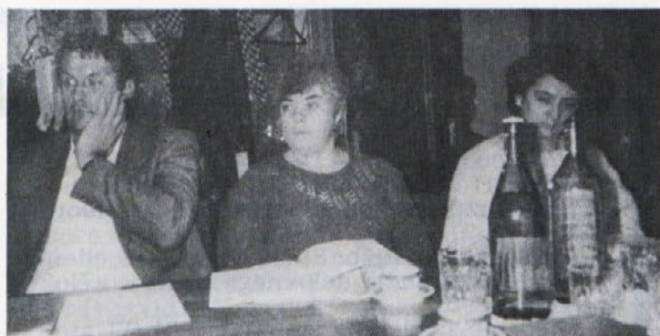
Delegatki delavskega sveta DO iz Delte in njihov direktor na zadnji seji delavskega sveta. Teško bo uganiti, kaj direktorja tako očitno skrbi. V današnjem gospodarskem trenutku je več kot dovolj povodov za to...

PONUJTE DRUGIM SVOJE ZNANJE IN PRI SVOJEM DELU BOLJ KOT SEDAJ KORISTITE ZNANJE DRUGIH, SAJ BOSTE NA TA NAČIN NAJVEČ PRISPEVALI K ZAPOSLOTVI MLADIH OZ. SVOJIM OTROK, K PREMAGOVANJU GOSPODARSKIH TEŽAV IN KVALITETI ŽIVLJENJA.