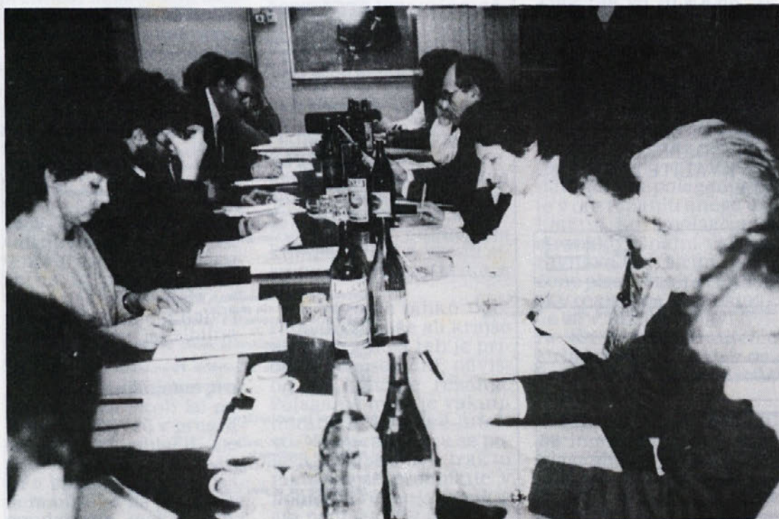
Z zadnje seje poslovnega odbora.

Kandidati bodo obveščeni o izidu oglasa v 15 dneh po sprejetju sklepa o izbiri.