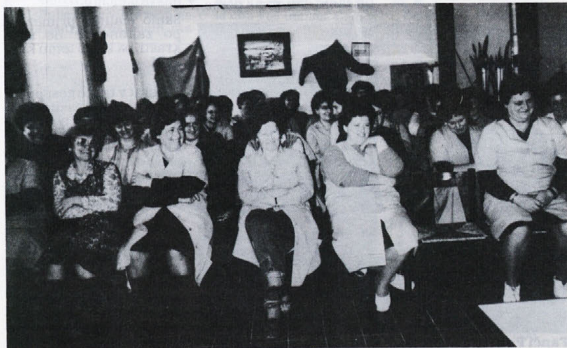
S predavanja o menopavzi v tozdu Temenica. Predavanje je bilo v jedilnici, kjer je bila tudi razstava ročnih del. Nekaj izdelkov vidimo tudi na posnetku.